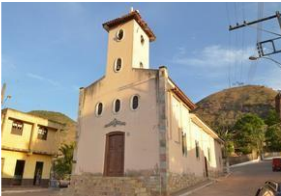
Figura 2: Capela de Santo Antônio.