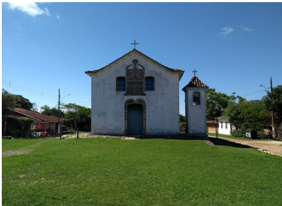
Figura 3: Capela de Sant'Ana construída em 1883.

A pequena vila é composta por construções e casas organizadas ao longo de uma rua, cercando a Capela de Sant'Ana (FIGURA 3). Ela tem atraído visitantes e turistas interessados na beleza da Serra do Trovão e nas cachoeiras do Falcão e Castelinho (EXPLOREMG, 2018, [digital]). Além disso, a vila participa de eventos como a tradicional Festa em honra a Sant'Ana e o evento culinário Gastroarte da Chapada, que é organizado por empresários do setor de hospitalidade e alimentação. O Gastroarte apresenta diversas iguarias, incluindo licores, cachaças, torresmo conservado em banha de porco, ora-pro-nóbis, urtiga, bamba de couve, tropeiro, frango ao molho pardo, entre outros, atraindo principalmente moradores da região (Fortes e Carvalho, 2019).