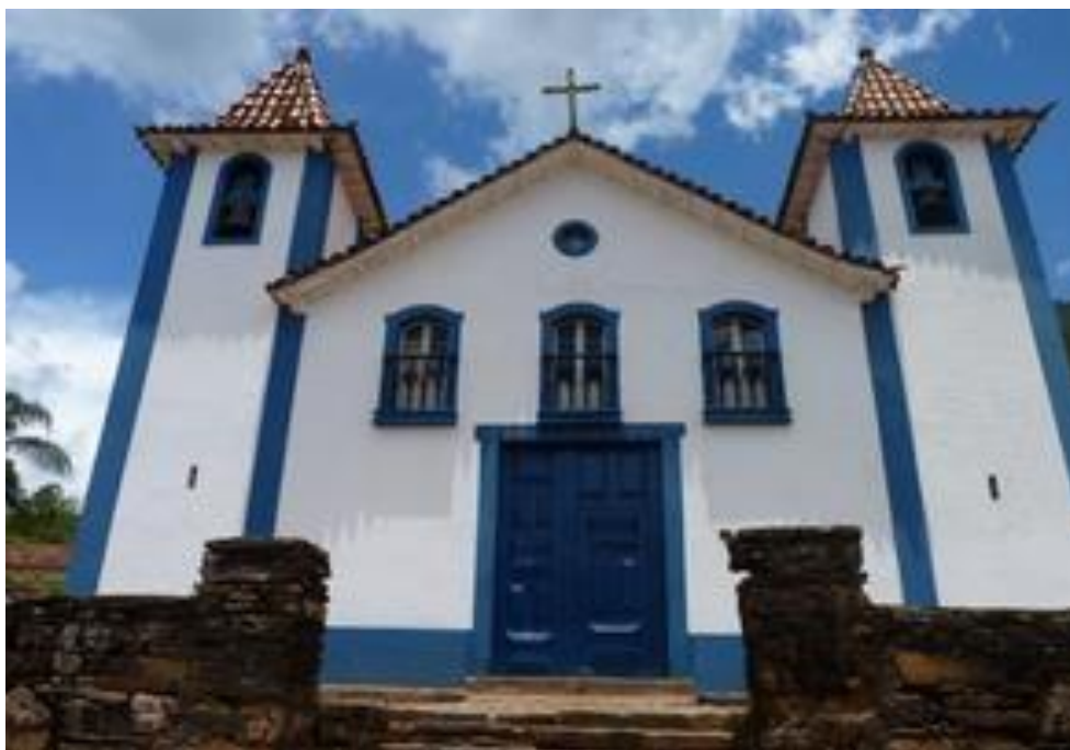
Figura 1: Igreja Matriz de São Bartolomeu.