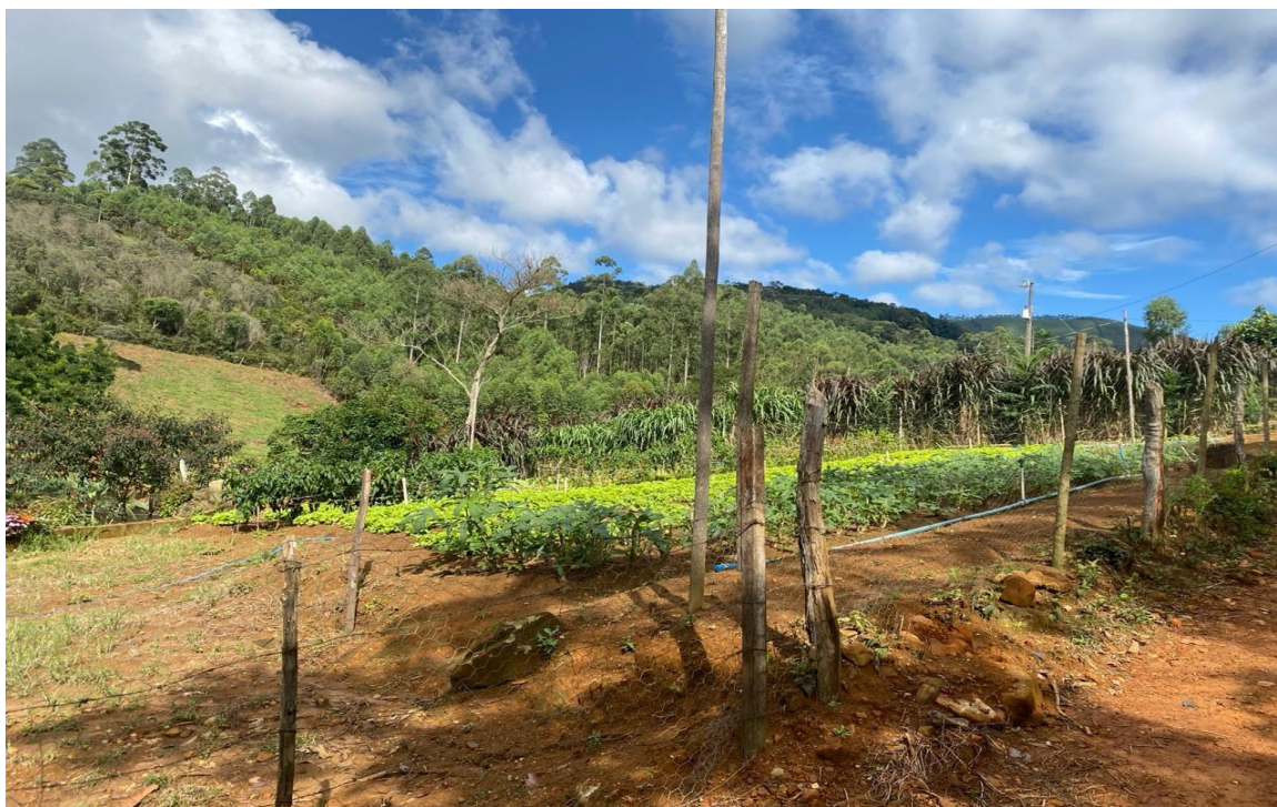
Figura 3 – Produção de hortaliças na região