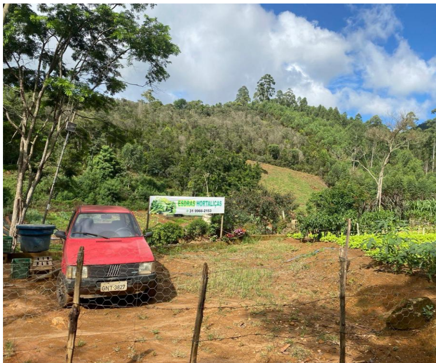
Figura 2 – Produção de hortaliças