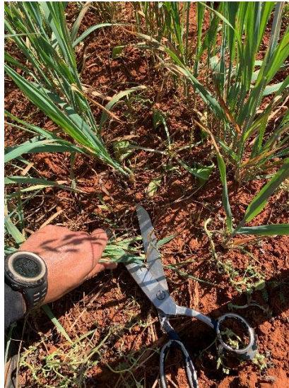
Figura 6: Coleta da linha de plantio, com o auxílio da tesoura