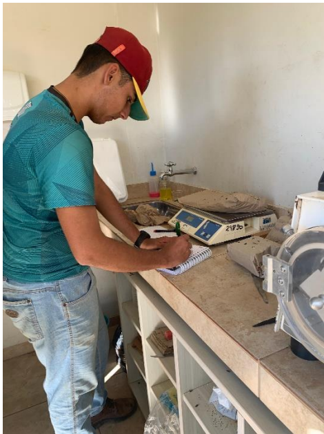
Figura 9: Pesagem do material seco a ser enviado.