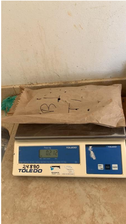
Figura 7: Pesagem da matéria natural.