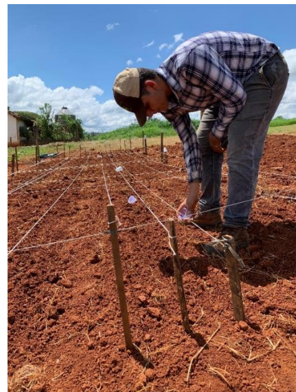
Figura 4: Semeadura manual, com o auxílio de copos descartáveis.