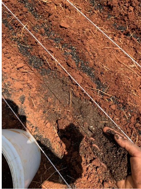
Figura 5: Substrato distribuídos na linha.