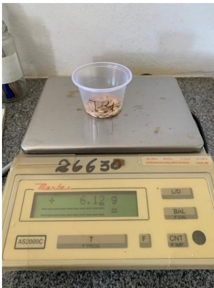
Figura 3: Balança de precisão utilizada para pesagem das sementes, com o auxílio de um copo de plástico.

A distribuição das sementes foi realizada com espaçamento entre linhas de 0,17 cm, comprimento de linha de 2 m e o espaçamento entre plantas, variável de acordo com o tratamento.