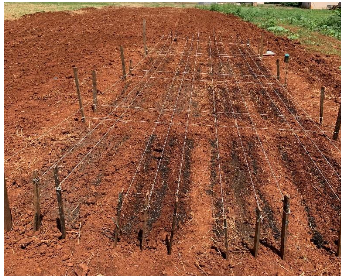
Figura 2: Distribuição dos blocos e tratamentos na área.

O experimento foi conduzido em blocos e colocou-se barbantes para demarcar as linhas de plantio (Figura 2).