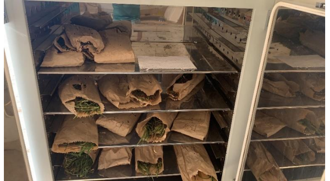
Figura 8: Secagem do material na estufa.