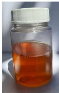
Figura 3: Amostra de mel após aquecimento.

Para dissolução de cristais de açúcares, utilizaram-se três métodos de aquecimento: micro-ondas e banho-maria (40°C e 100°C). A Figura 3 apresenta amostra de mel após aquecimento.