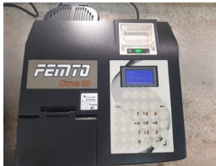
Figura 4 – Espectrofotômetro utilizado na determinação de Hidroximetilfurfural (HMF) em amostras de mel.

As análises foram realizadas no Laboratório Físico Químico do setor de Controle de Qualidade da Empresa Bee Própolis Brasil LTDA, situada em Bambuí - MG. A metodologia utilizada para determinar HMF foi a recomendada por Instituto Adolfo Lutz (2008), descrita no APÊNDICE A, utilizando-se o espectrofotômetro da marca FEMTO Cirrus 80 (Figura 4).