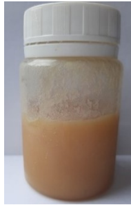
Figura 2 - Amostra de mel completamente cristalizada.