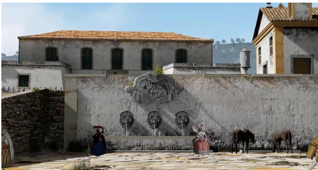
Figura 7 - Chafariz da Praça - Transição do séc. XVIII para o XIX

Fonte: Representação em 3D da Praça Tiradentes em Ouro Preto - 2020 - PAISAGENS PITORESCAS 16