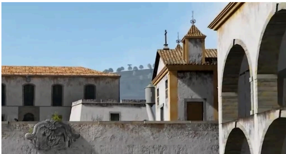
Figura 3 - Capela de Santana - Transição do séc. XVIII para o XIX