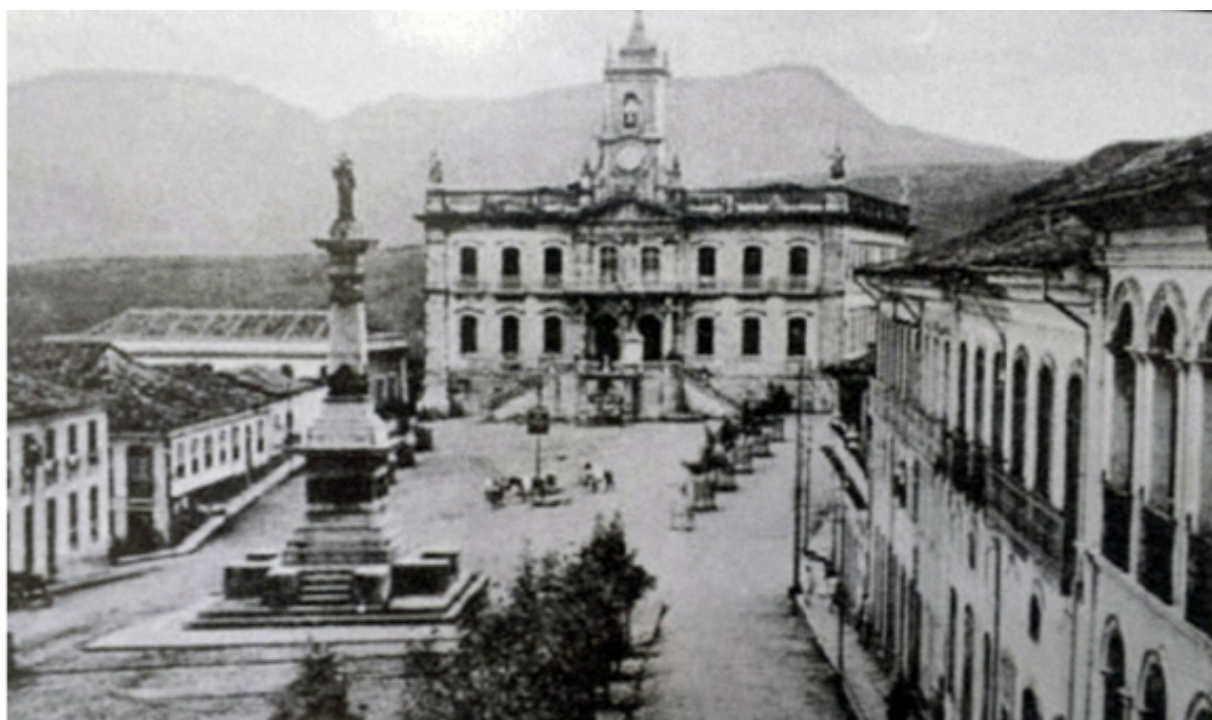
Figura 14 - Praça Tiradentes, início do Séc. XX . Ainda em processo de transformação