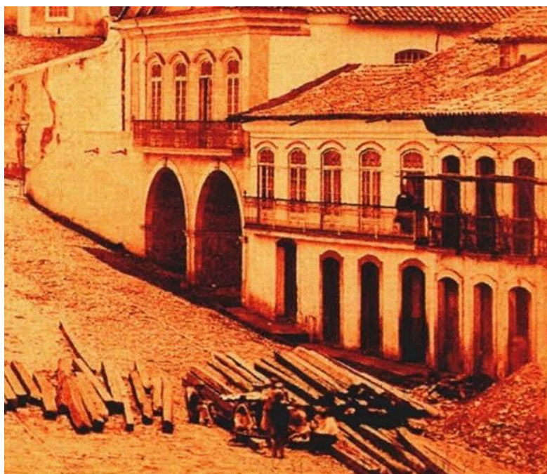
Figura 8 - Gravura de Hermann Burmeister - 1860/1875