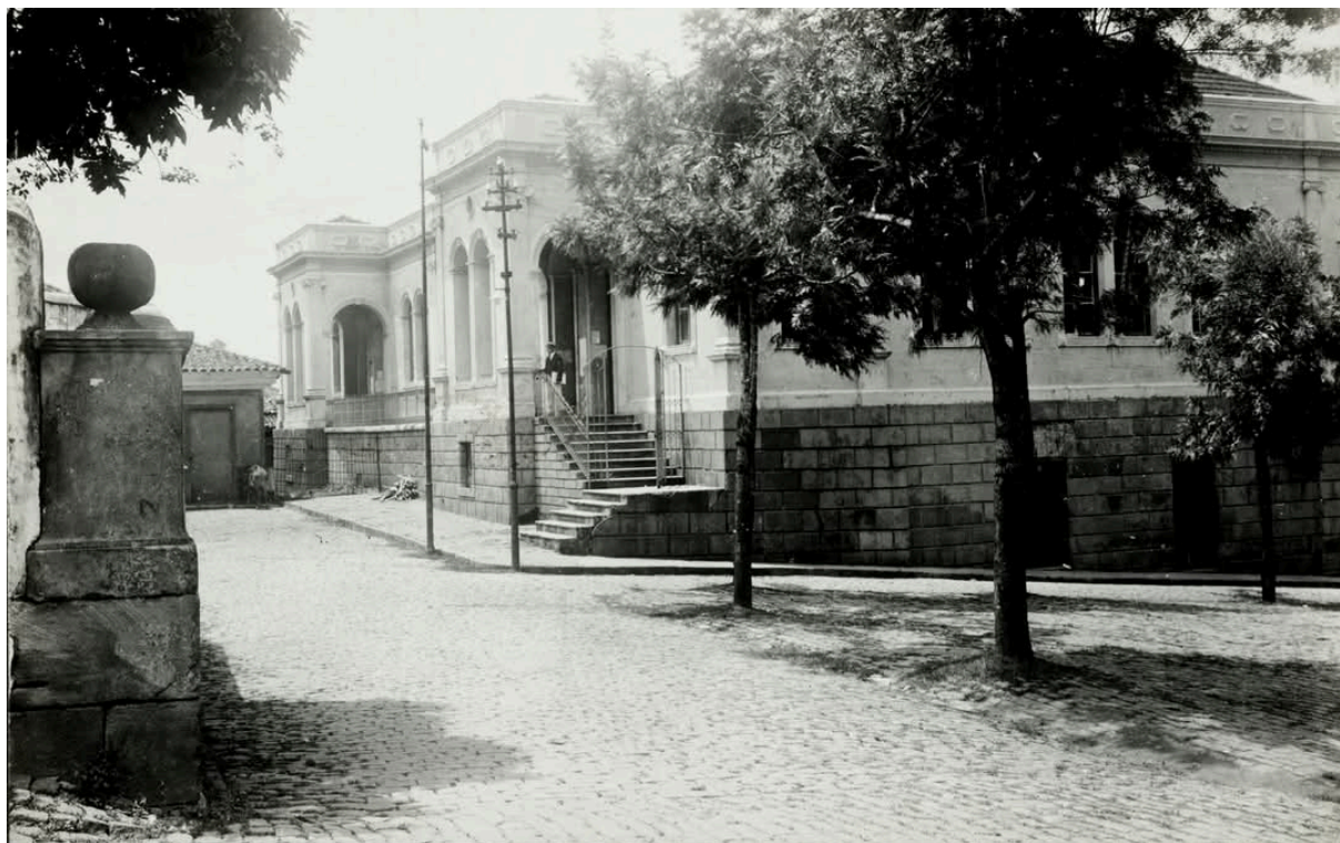
Figura 9 - Fórum de Ouro Preto, início do século XX, antes do incêndio em 1923.