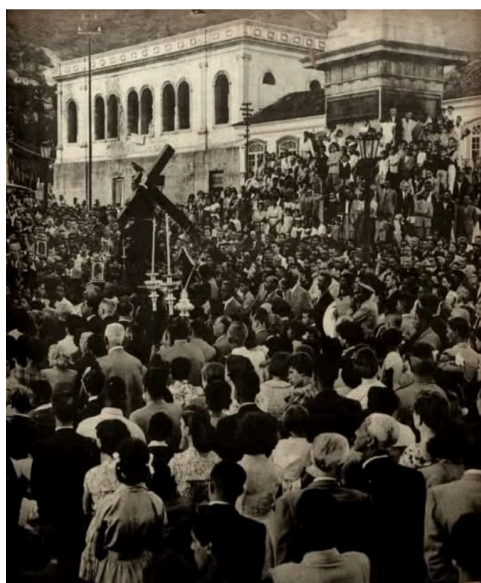
Figura 17 - Praça Tiradentes - meados do Séc.XX