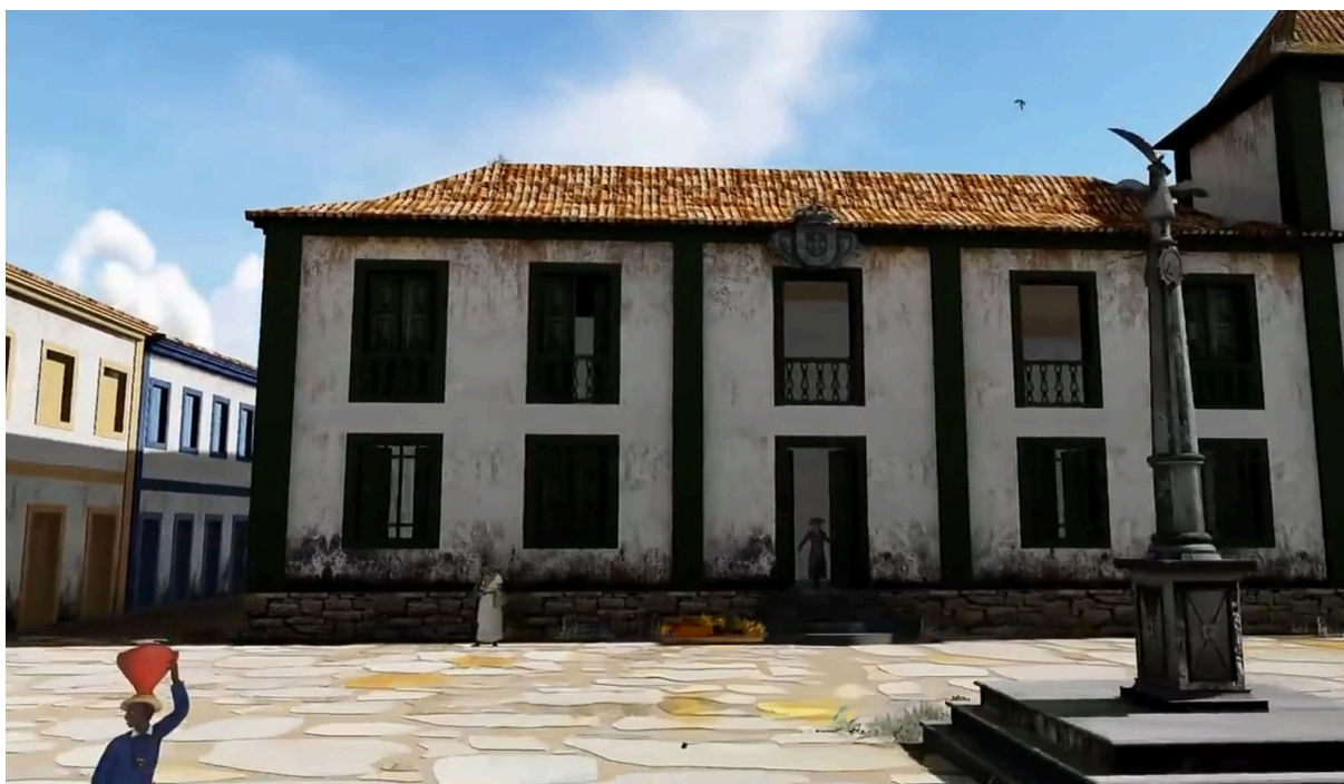
Figura 6 - Pelourinho - Transição do séc.XVIII para XIX

Fonte: Representação em 3D da Praça Tiradentes em Ouro Preto - 2020 - PAISAGENS PITORESCAS