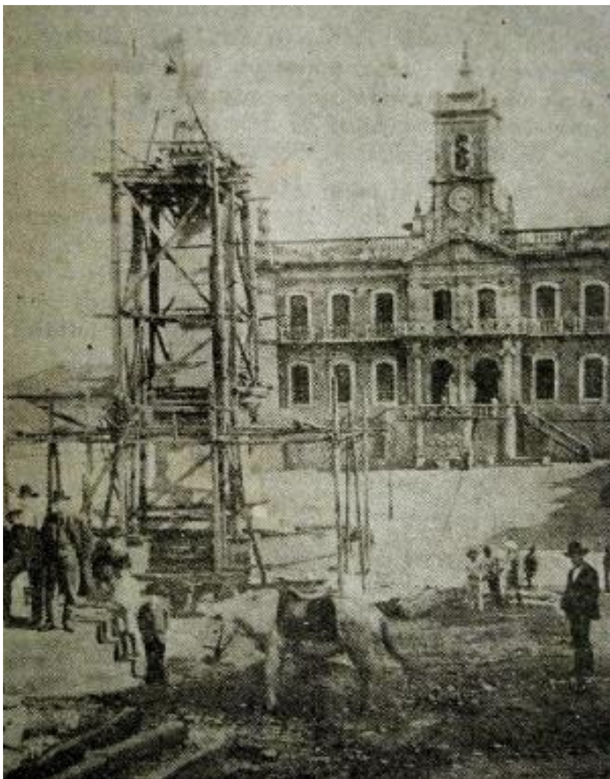
Figura 12 - Construção do monumento em homenagem a Tiradentes 1892