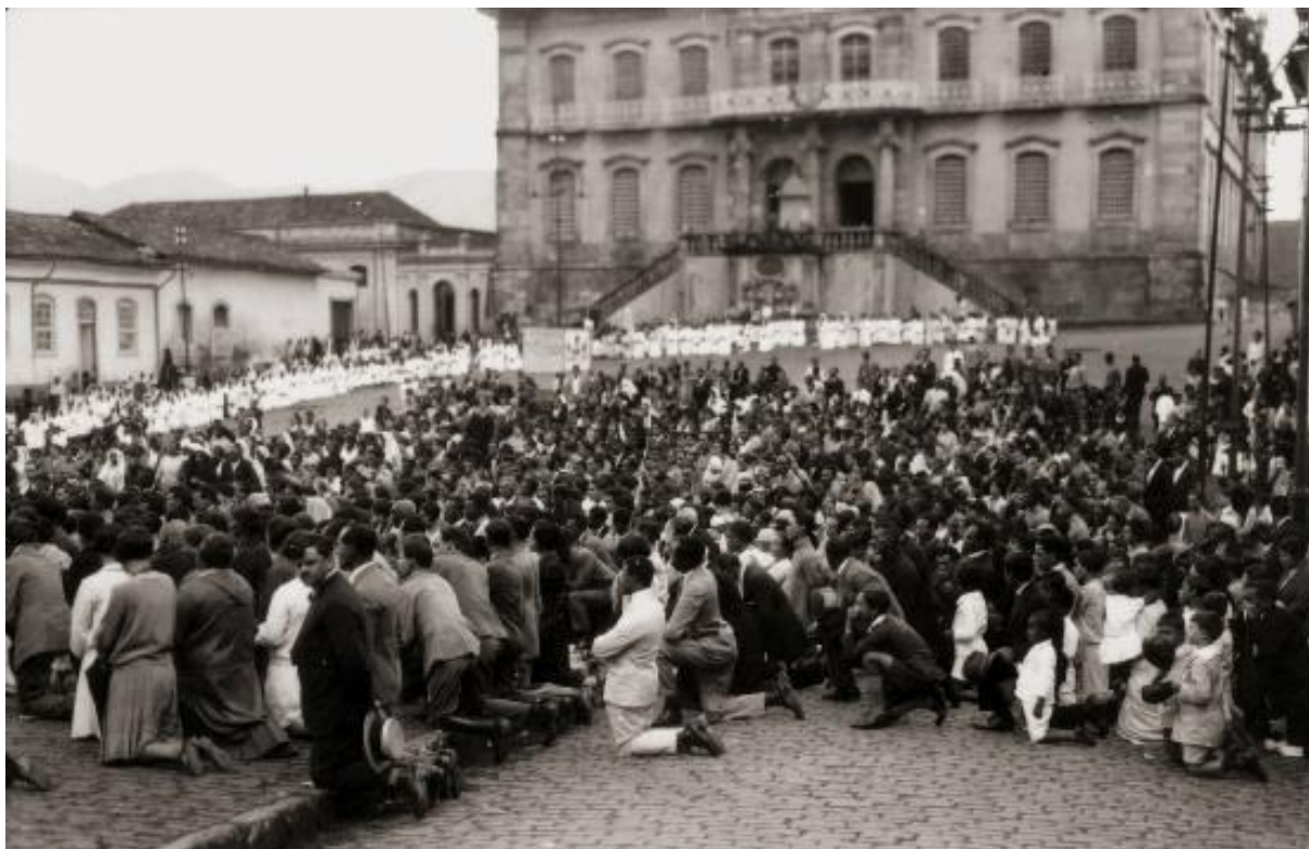
Figura 15 - Praça Tiradentes, início do Séc. XX - Modificações arquitetônicas e celebração religiosa