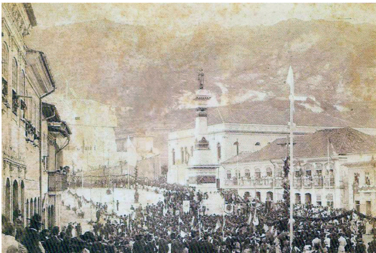
Figura 13 - Inauguração do monumento em homenagem a Tiradentes 1894