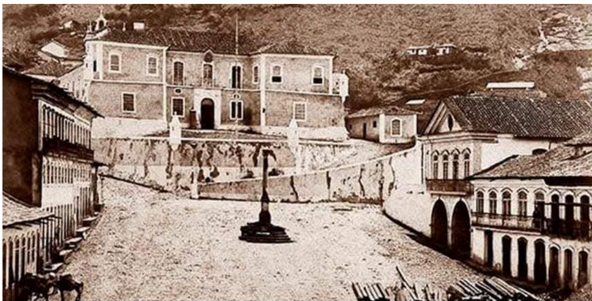
Figura 5 - Praça Tiradentes - 1897 - Reinstalação do Pelourinho, obras da Câmara e Cadeia