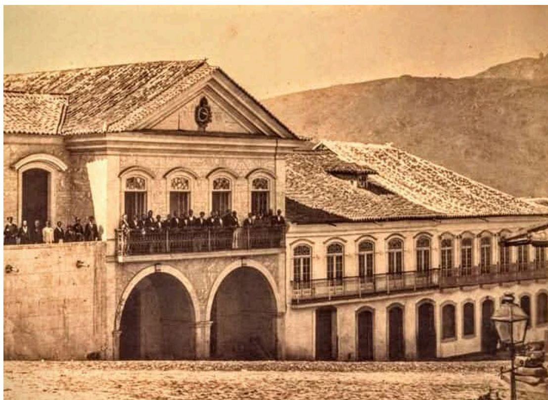
Figura 2 - Fachada da Santa Casa da Misericórdia em 1870/75, já em funcionamento como sede da Assembleia Legislativa de Minas Gerais