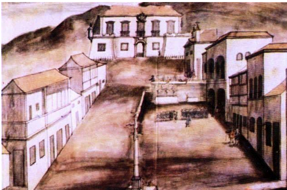
Figura 1 - Praça Tiradentes entre os anos de 1785-1790, com o Palácio dos Governadores ao fundo, conjunto Alpoim à esquerda.

Fonte: Acervo Museu da Inconfidência - REVIVA OURO PRETO