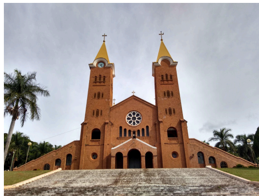
Figura 8: Santuário de Nossa Senhora da Abadia, em Romaria (MG).