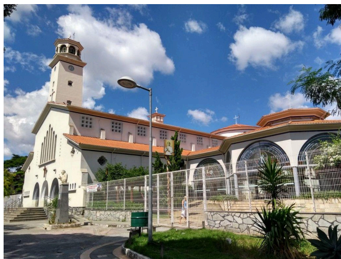
Figura 15 - Fachada com a visão bloqueada pela construção do anexo.. Data: 2009.

A principal obra de modificação do projeto original foi feita em 2006. Anteriormente sepultado no interior da igreja, os restos mortais do Beato foram transferidos para um “Memorial” (anexo) construído que se assemelha com a arquitetura da igreja. A fachada lateral da igreja foi totalmente bloqueada pelo “Memorial”. Além disso, a praça foi totalmente gradeada, e passou a ser utilizada como estacionamento. Um distanciamento entre a igreja e o ambiente de convivência.