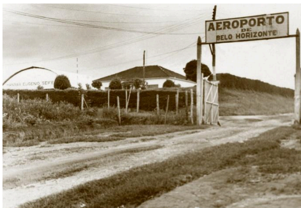
Figura 1 - Aeroporto de Belo Horizonte, na região da ex-colônia Carlos Prates. Data: 1942.