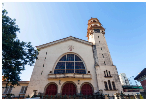
Figura 6: Igreja Nossa Senhora do Carmo, no Bairro Sion - Belo Horizonte (MG).

O edifício ainda contempla interpretações e simbologias bíblicas nas concepções da fachada, esquadrias e ornamentação. As portas frontais em três partes, remetem à Santíssima Trindade (Fig. 07). Os vitrais na fachada, e as janelas laterais, também seguem a numerologia bíblica. Essa configuração também foi empregada no Santuário de Nossa Senhora da Abadia, na cidade de Romaria (Fig. 08). A igreja também construída por investida do Beato, recebe as mesmas simbologias bíblicas nas portas e vitrais.