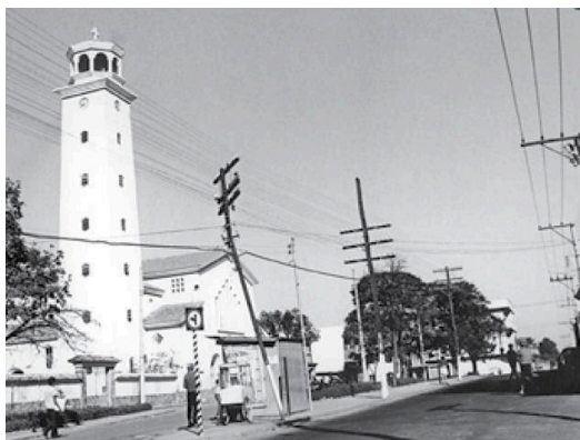
Figura 12 - Vista da Rua Padre Eustáquio na década de 70. Fonte História dos Bairros de Belo Horizonte - Região Noroeste – PBH