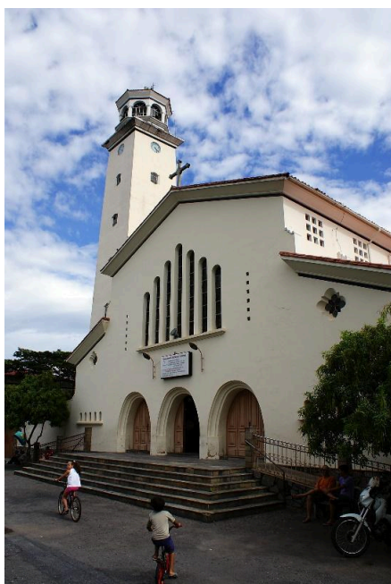
Figura 16 - Praça da igreja com área de convivência, antes do fechamento da praça.