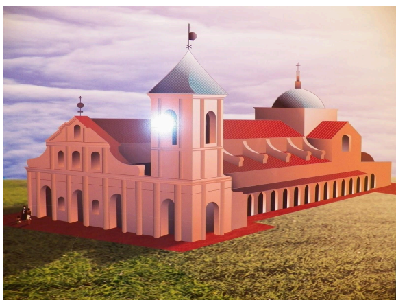
Figura 3: Redução de Trinidad del Parana (Paraguai), com a torre no lado oposto da de São Miguel Arcanjo, projeto gráfico.