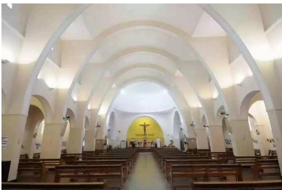
Figura 9: Vista da nave central. Data: 2023.

A decoração interna, à romana, recorda a verdadeira Igreja, também apostólica, na representação interna católica, universal; na decoração externa, conquanto assim fundada pela Doutrina, pelos seus apóstolos e pela sua Sede o que é sobejamente conhecido (Padre Eustáquio van Lieshout – 06/08/1942).