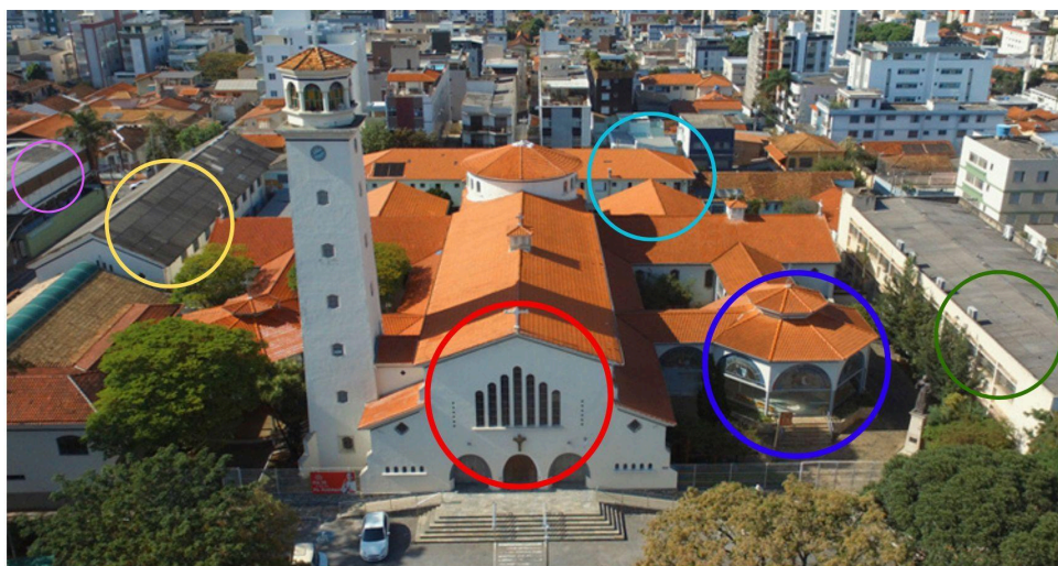
— Igreja — Obra Social — Centro Paroquial — Túmulo — Casa da Congregação — Colégio

A arquitetura das Igrejas da Companhia na América é das mais ricas juntamente com as outras ordens mendicantes. Destacam-se na paisagem urbana de todas as grandes cidades americanas e em geral não muito distantes das catedrais. Formam conjuntos ocupando manzanas inteiras como o colégio, a igreja, as residências dos padres e nas imediações das cidades, as fazendas. (Tirapelli, 2018, p.227).