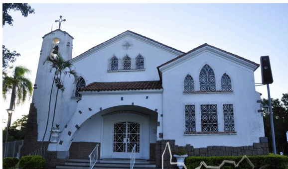
Figura 5: Igreja Nossa Senhora da Assunção, em Vila Assunção - Porto Alegre (RS). Data: 2011.