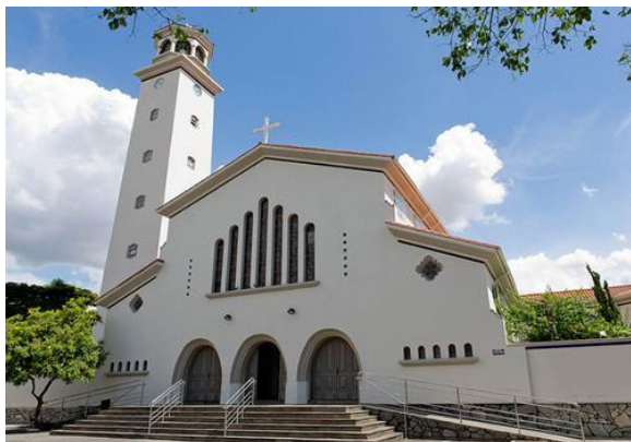
Figura 7: Fachada do Santuário da Saúde e da Paz.

Na parte frontal ou anterior há três portas unidas (ladeadas por cinco janelas e encimadas por sete vitrais) e mais quatro portas laterais atendem ao escoamento do povo. Do lado de fora, à esquerda está uma torre, que mede trinta e cinco metros de altura e receberá três sinos. Simbolicamente, por não dizer liturgicamente, demos o sentido de tudo isso: as três portas frontais, corresponde a Trindade Santíssima; as dez janelas laterais, os dez mandamentos; os sete vitrais, os sete sacramentos; as duas portas laterais os corações de Jesus e de Maria; os sinos os três convocadores: São Pedro o primeiro, São João Batista o segundo e o terceiro Ave Maria ou o Arcanjo Gabriel. (Padre Eustáquio van Lieshout – 06/08/1942)