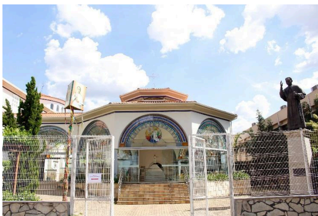
Figura 14 - Memorial. Fonte: Paróquia dos Sagrados Corações.

A igreja, assim, se torna um complexo em toda a sua estrutura da presença do Beato. É recorrente ver fiéis rezando, e fazendo orações no lado de fora do templo, no jardim ou do outro lado da rua. A Igreja é a imagem de Padre Eustáquio, não apenas o relicário, mas o edifício que carrega a imagem do Beato e seu corpo. Como assevera Franco Júnior,, “pelo contato direto com relíquias, o próprio relicário deixava a condição de objeto profano para se tornar ele mesmo sagrado” (Franco Júnior, 2010, p.19).