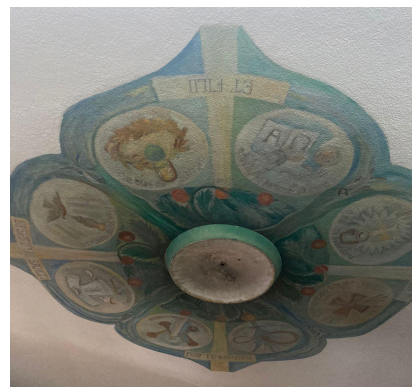
Figura 10: Pinturas no forro da sala de batismo.. Data: 2024.

No projeto elaborado por Padre Eustáquio, o quarteirão 3, doado pela prefeitura, também estava o anexo das Obras Sociais que contemplaria ambulatório hospitalar para