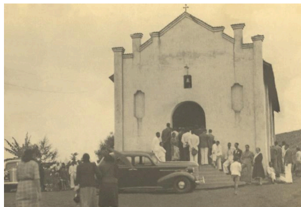
Figura 2 - Capela Cristo Rei, na primeira celebração de Padre Eustáquio na Vila Bela Vista. Data: 1942.

A reputação de “milagreiro” acompanhou Padre Eustáquio desde sua primeira paróquia em Água Suja até a capital. Esse reconhecimento atraiu um fluxo constante de fiéis, curiosos e pretendentes a conexões com o beato na Vila Bela Vista. “A partir da movimentação social em torno da figura de Frei Eustáquio” (Corrêia, 2014, p.54), o envolvimento com personalidades e políticos viabilizou a concretização de seus empreendimentos. Destaca-se a notável conexão com Juscelino Kubitschek, que desempenhou papel significativo na jornada para a construção do complexo da igreja.