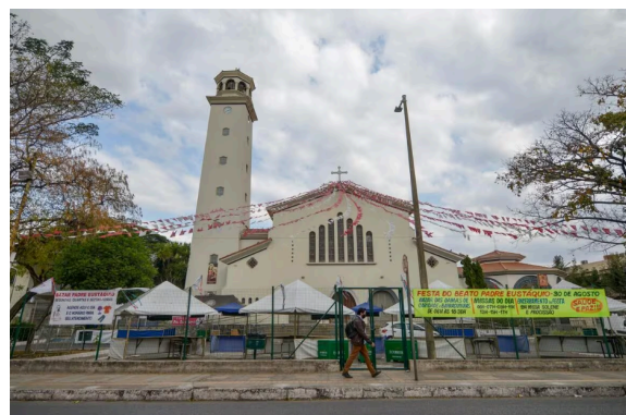
Figura 17 - Praça da igreja com grades e portões. Data: Agosto de 2023.

Diante das constantes mudanças de gestão, é necessário que um meio legal seja definido para assegurar elementos centrais da originalidade do edifício, projetado com a visão do próprio Beato que dá nome ao bairro, à rua e ao popular templo. Isso se torna urgente, pois não existe nenhum processo de tombamento aberto ou recusado para a Igreja, e a mesma não foi inventariada pelo município. Em 2016, o Conselho Deliberativo do Patrimônio Cultural de Belo Horizonte discutiu um possível tombamento da Rua Padre Eustáquio 7 . Uma das ruas mais antigas da capital, foi anteriormente rota dos tropeiros, como a “Estrada para Contagem”, no município vizinho onde havia o posto de contagem de mercadorias.