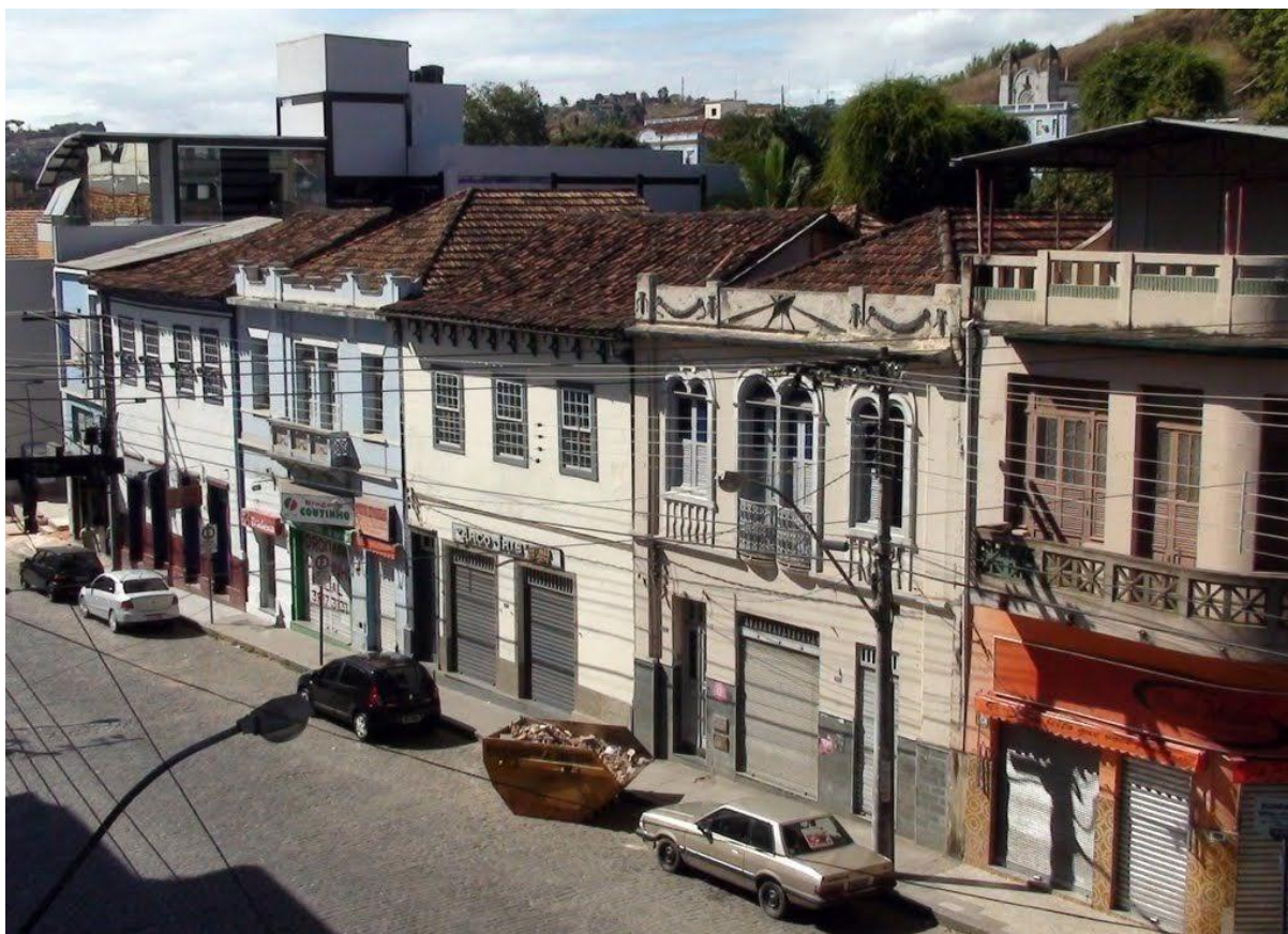
Fig. 01: Vista parcial de uma das principais vias do núcleo histórico de Ponte Nova.