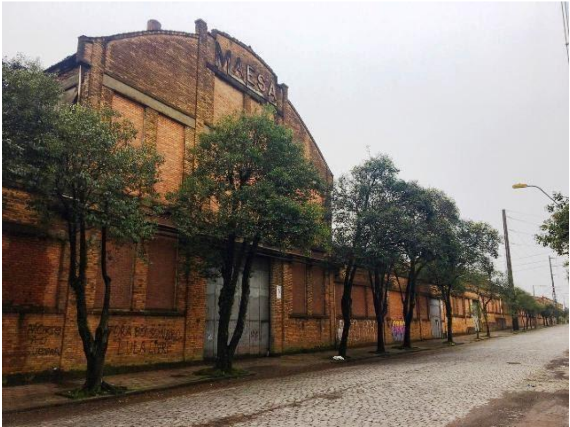
Figura 04: Detalhe da fachada frontal da Metalúrgica Abramo Eberle S/A.