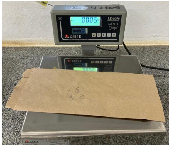
Figura 6 – Peso da matéria seca do sistema radicular da cebola

Após a pesagem inicial, o sistema radicular foi acondicionado em sacos de papel kraft, identificados por tratamento e colocado para secar em estufa com circulação forçada, mantendo-se a temperatura entre 65 e 70°C. O tempo de secagem foi determinado por pesagens das amostras até que o peso se mantivesse constante. Após a secagem, as amostras foram pesadas novamente para determinar a massa seca final (Figura 6).