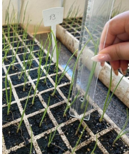
Figura 2 – Medição de altura das mudas de cebola

Para a obtenção da altura, as mudas foram medidas individualmente com o uso de régua (Figura 2).