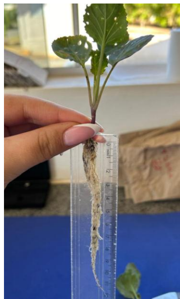
Figura 3 – Medição de comprimento de raiz do repolho

Para a obtenção do comprimento de raiz das plantas foi necessário lavar as raízes para a retirada do substrato. Após isso, com o auxílio de uma régua as raízes foram medidas individualmente (Figura 3).