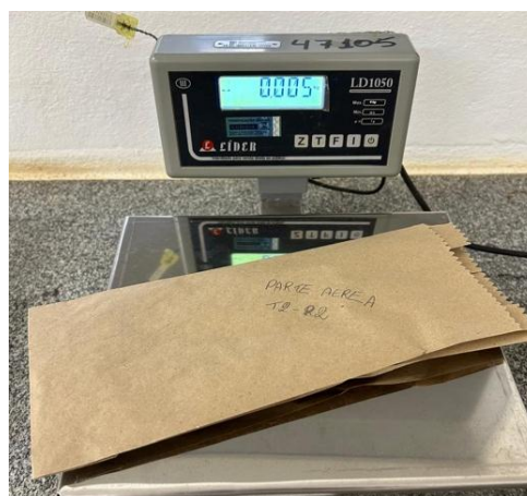
Figura 5 – Peso da matéria seca da parte aérea do repolho

Após pesagem inicial, a parte aérea foi acondicionada em sacos de papel (kraft) identificados por tratamento e colocadas para secar em estufa com circulação forçada, mantendo-se a temperatura na faixa de 65 a 70° C. O tempo de secagem foi determinado por pesagens das amostras até a manutenção de peso constante. As amostras, após a secagem, foram pesadas novamente para determinar a massa seca final (Figura 5)