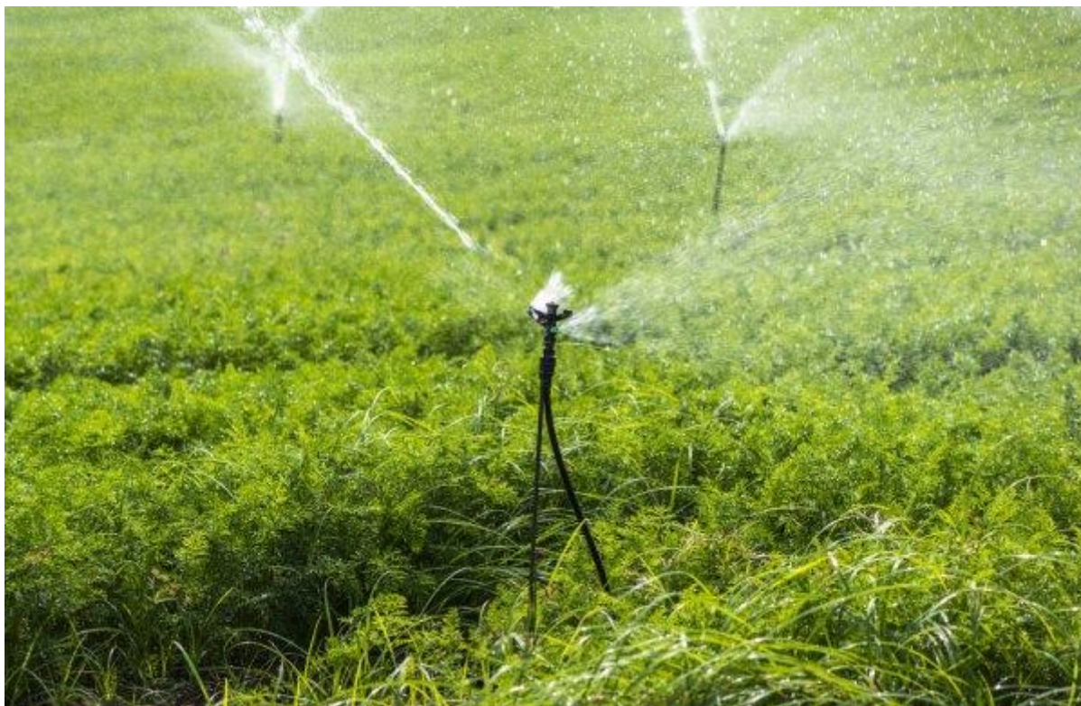
Figura 4. Imagem sistema de irrigação por aspersão

aparecimento de doenças em algumas culturas e interferir com tratamentos fitossanitários; pode favorecer a disseminação de doenças cujo veículo é a água (ANDRADE; BRITO, 2000).