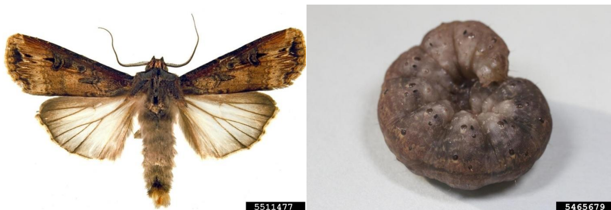
Figura 1. Agrotis ipsilon . Fêmea adulta. Figura 2. Agrotis ipsilon . Lagarta