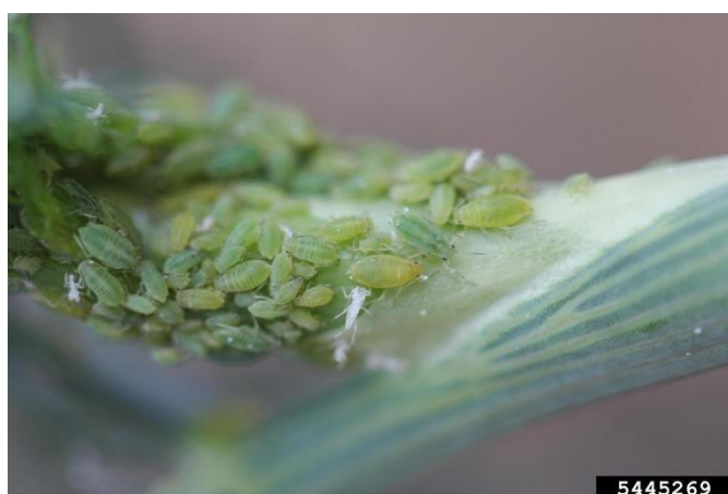
Figura 3. Pulgão Cavariella aegopodii na cultura da cenoura