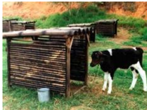
Figura 11: Bezerreiro individual de madeira.