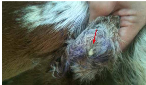
Figura 2: Onfalite em bezerro.

Conforme Kliemann e Werle (2024), o umbigo é vital para a comunicação entre o feto e a mãe, transportando nutrientes e oxigênio. Segundo Cardoso e Andrade (2024), as onfalopatias, ou seja, alterações patológicas causadas infecção bacterianas por falta de higiene ou tratamento inadequado, não devem ser consideradas normais, pois afetam o desenvolvimento dos neonatos, como pode ser observado na Figura 2. A cura do umbigo, com limpeza e aplicação de soluções antissépticas, como tintura de iodo a 10%, é crucial logo após o nascimento.