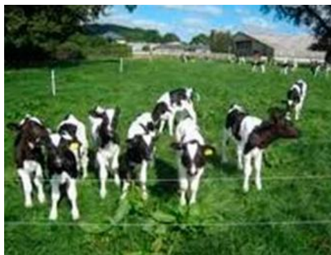
Figura 6: Bezerreiro coletivo em piquetes.