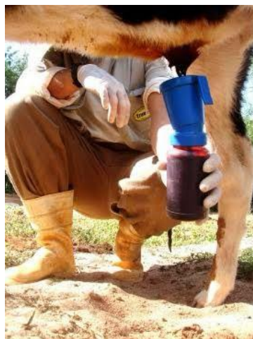
Figura 3: Cura do umbigo.

vida e, posteriormente, diariamente, como na Figura 3. Esse procedimento é crucial para prevenir infecções e garantir a saúde do bezerro.