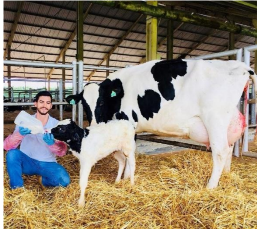
Figura 1: Realização da colestragem.

profissional. Fatores como tempo pós-parto e quantidade de colostro ingerido influenciam a absorção de imunoglobulinas.