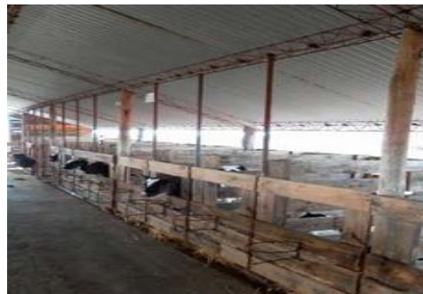
Figura 10: Bezerreiro individual em baias (alojamento em tie-stall).