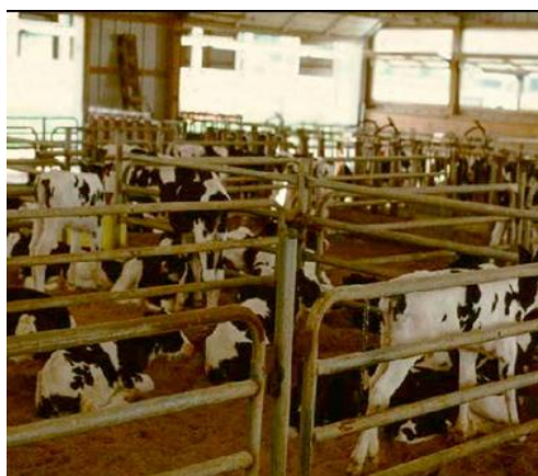
Figura 7: Bezerreiro coletivo em gaiolas.