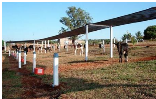
Figura 12: Bezerreiro individual em estacas (Sistema Argentino).