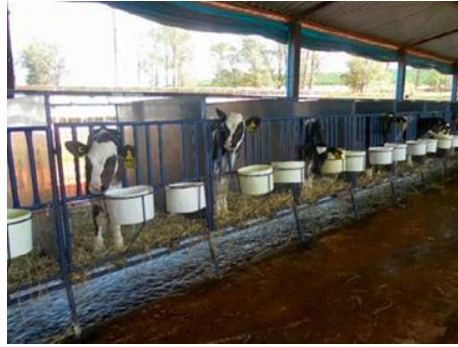
Figura 9: Bezerreiro individual em gaiolas suspensas.