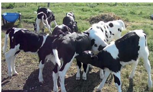
Figura 8: Mamada cruzada entre bezerros.

Fonte: BITTAR, C. M. M.; MIQUEO, E. (2019).