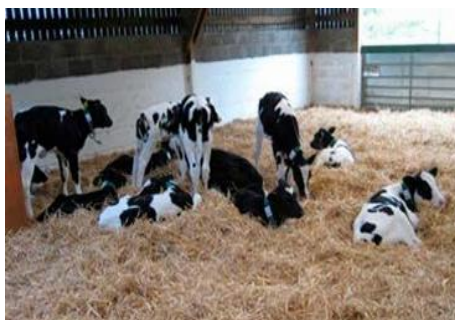
Figura 4: Bezerreiro coletivo em galpão.