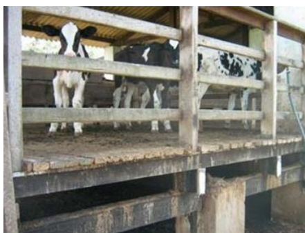
Figura 5: Bezerreiro coletivo suspenso.