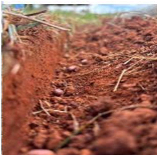
Figura 3 - Informações do Plantio