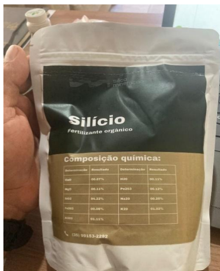
Figura 4 - Silício utilizado

procedeu-se à mensuração da altura, empregando-se uma trena graduada, considerando a distância do colo até o ápice da haste principal, com o intuito de relacionar possíveis impactos fitossanitários sobre o crescimento. A Figura 4 apresenta o silício utilizado.