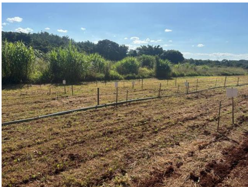
Figura 1 - Local do Experimento