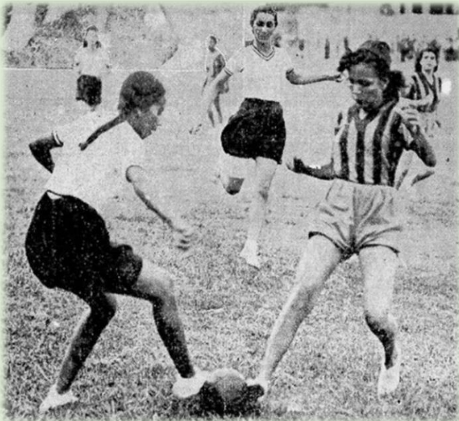
(Festival esportivo suburbano realizado no campo de Bom Sucesso F.C. em maio de 1940)

O sexismo refere-se à discriminação ou preconceito com base no gênero, em que se atribuem características, papéis ou valores específicos a indivíduos com base no sexo, prejudicando principalmente as mulheres (CONNELL, 2005). Essa prática manifesta-se em diversas áreas da sociedade, como no ambiente de trabalho, educação, esportes e relações interpessoais. O sexismo pode se manifestar de maneiras sutis ou explícitas, perpetuando estereótipos prejudiciais e contribuindo para a desigualdade de gênero.