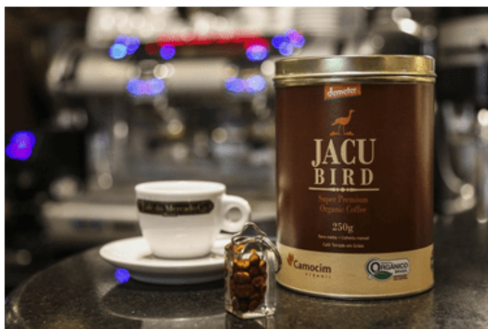
Figura 3: Café Jacu comercial.

Você sabia que aqui no Brasil há um tipo de café tão exótico quanto o Kopy Luwak? Trata-se do café Jacu (Jacu Bird Coffee - Figura 3), cujos grãos são obtidos a partir das fezes do Jacu ( Penelope sp. ), ave nativa das florestas latino-americanas, e que aqui no Brasil conta com pelo menos setes espécies diferentes.