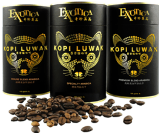
Figura 2: Kopy Luwak comercial.

se alimentam dos frutos de café, sem a interferência humana. Mas sem dúvidas, o alto preço do Kopy Luwak deve-se principalmente à sua raridade, decorrente de sua produção muito limitada, uma vez que são produzidos menos de 230 kg deste café anualmente.