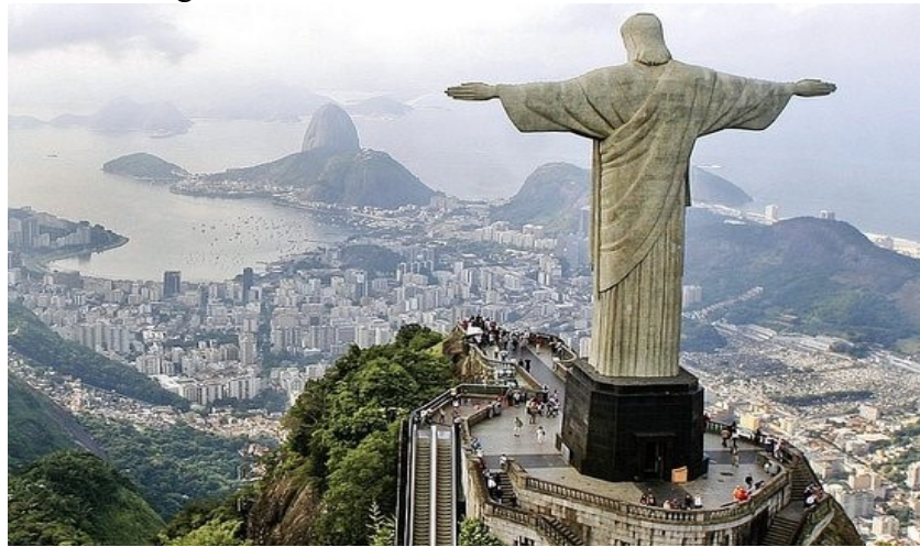
Figura 5 – Cristo Redentor no Rio de Janeiro