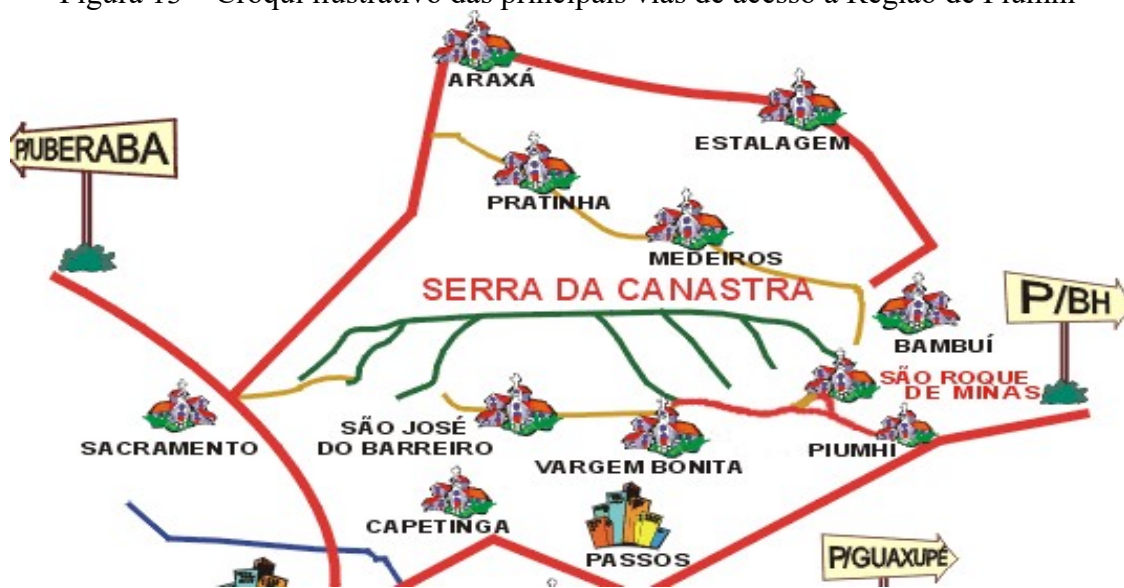
Figura 13 – Croqui ilustrativo das principais vias de acesso à Região de Piumhi

Neste acesso, o viajante pode se direcionar à Avenida Querobino Mourão Filho, no sentido ao centro da cidade, ou ainda à rua Severo Veloso, que dá acesso à bairros e à saída para a rodovia MG-341, que liga Piumhi a cidades como São Roque de Minas e Vargem Bonita, conforme ilustra a Figura 13.