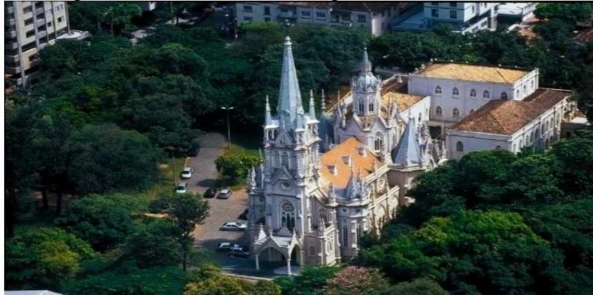
Figura 4 – Catedral da Boa Viagem em Belo Horizonte