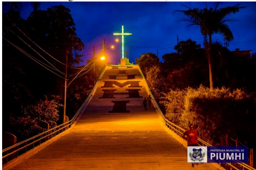
Figura 22 – Cruz do Monte, Piumhi

Além disso, o maior ponto turístico da cidade é a Ermida Nossa Senhora da Abadia, no morro da Cruz do Monte, um símbolo histórico e religioso da cidade, além de estar localizada em frente a uma vista panorâmica da cidade de Piumhi (Figura 22).