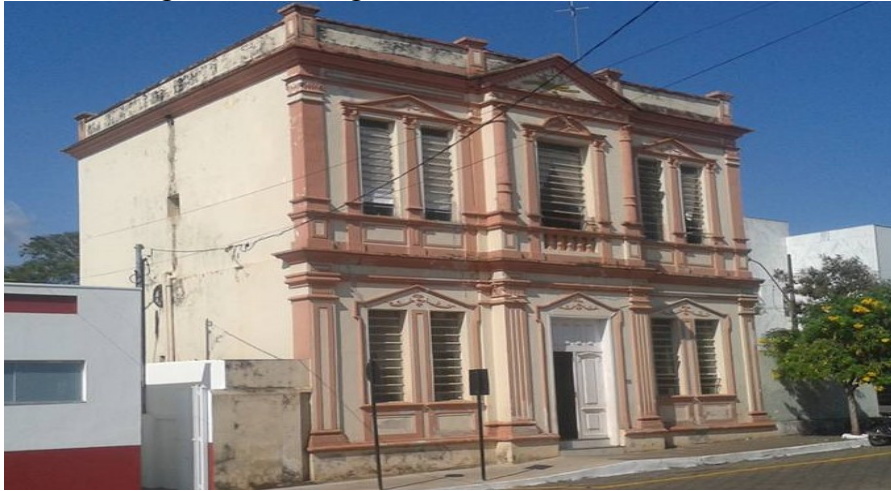
Figura 21 – Delegacia de Polícia Civil de Piumhi