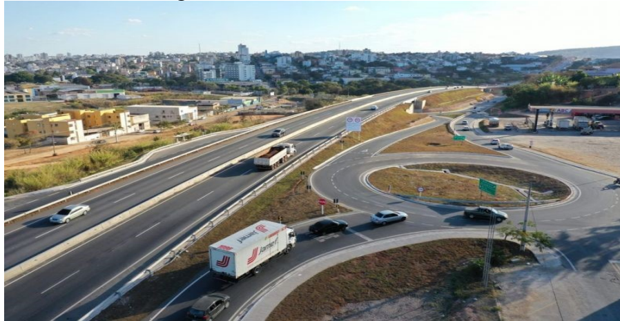
Figura 15 – Trevo MG 050 Piumhi