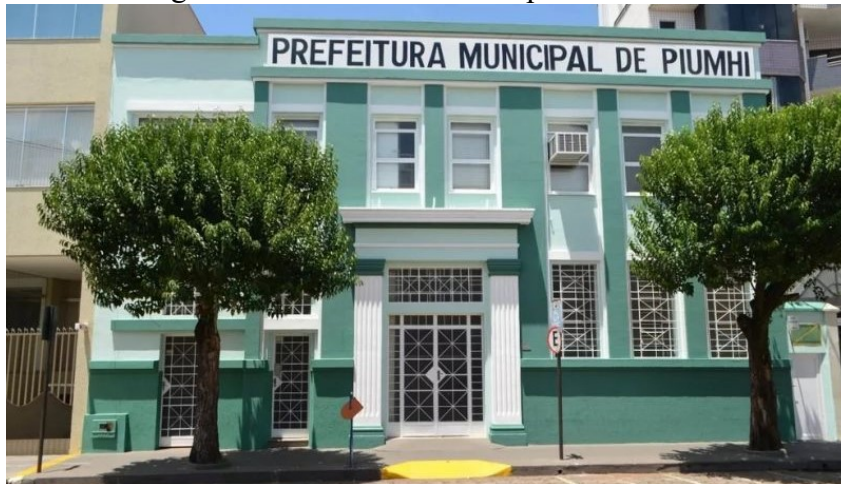
Figura 20 – Prefeitura Municipal de Piumhi

Alguns desses casarões hoje abrigam importantes órgãos públicos da cidade, como a Prefeitura Municipal (Figura 20) e a Delegacia de Polícia Civil (Figura 21), enquanto outros abrigam bares e restaurantes que recebem os visitantes do município.