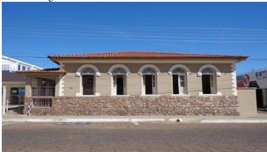
Figura 19 – Casa da Cultura da Cidade de Piumhi

As adaptações promovidas pela prefeitura da cidade estão relacionadas com a construção de rampas de acesso para pessoas deficientes e/ou com dificuldade de mobilidade, e melhor sinalização interna dos espaços e saídas (PREFEITURA DE PIUHMI, 2022).