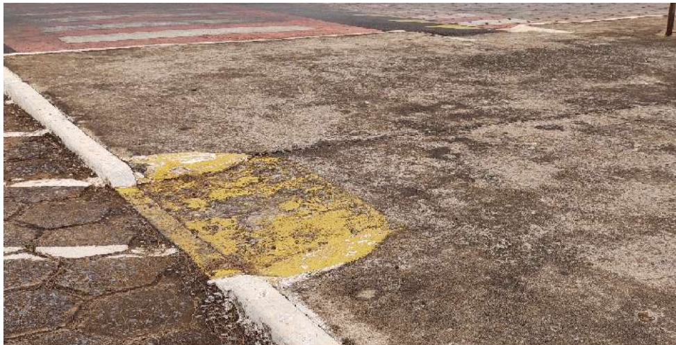
Figura 18– Rampas Acessíveis Praça Dr. Avelino de Queiroz

Através do estudo de caso feito na cidade de Piumhi-MG, foi comprovada a baixa acessibilidade das calçadas examinadas. O objeto do estudo em questão foram as calçadas da região central do município, onde foram identificadas irregularidades relacionadas à inclinação da rampa de acesso e sinalização, que estão em desacordo com a NBR 9050:2015 da ABNT, ou inexistem, o que tornam os percursos impróprios para o deslocamento de cadeirantes e portadores de deficiência visual (Figura 18).