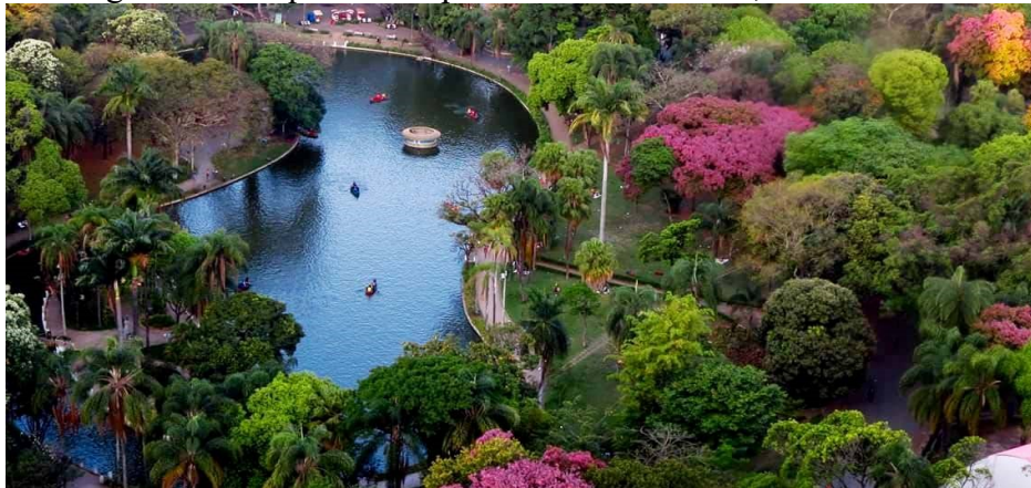
Figura 1 – Parque Municipal de Belo Horizonte, Minas Gerais

Como exemplo de acessibilidade pode-se citar o Parque Municipal em Belo Horizonte (Figura 1) um local destinado ao lazer público franqueado a toda a população da cidade, que pode acessá-lo de forma gratuita; a festa de carnaval de rua na cidade de Salvador (Figura 2) é uma grande manifestação cultural ao ar livre e, ao mesmo tempo, permite o lazer de uma coletividade; a disponibilização de uma adequada estrutura de transporte público como linhas de metrô, serviços de ônibus ou até mesmo a criação de uma rede de estradas interligando os municípios são diferentes tipos de acessibilidade.