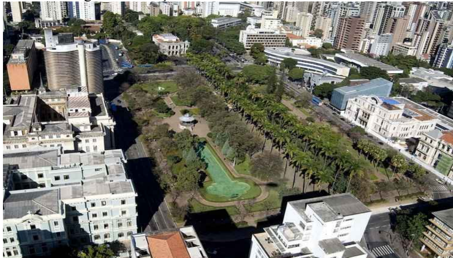
Figura 8 – Praça da Liberdade em Belo Horizonte