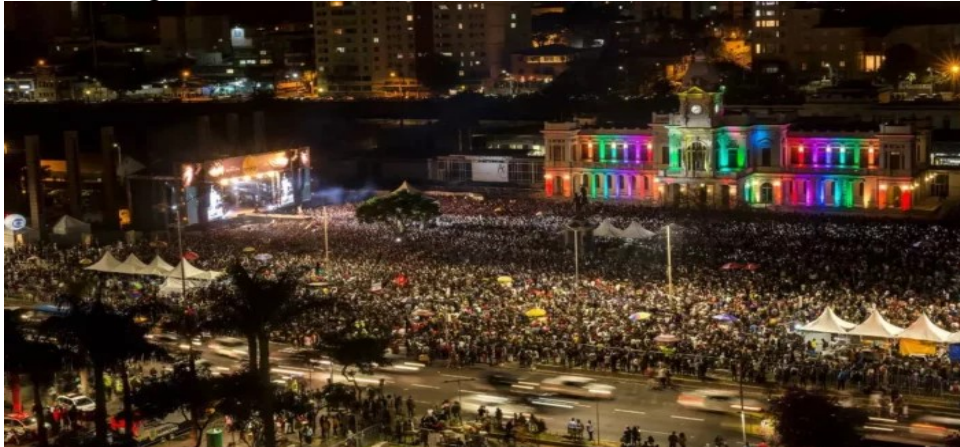
Figura 7 – Virada Cultural 2022 em Belo Horizonte MG