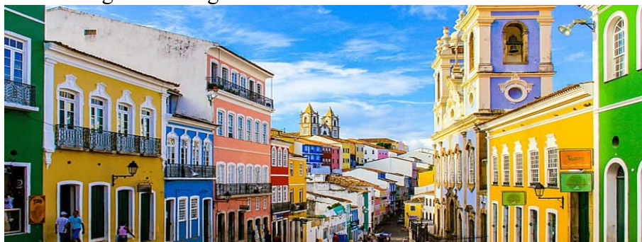
Figura 6 – Região do Bairro Pelourinho em Salvador