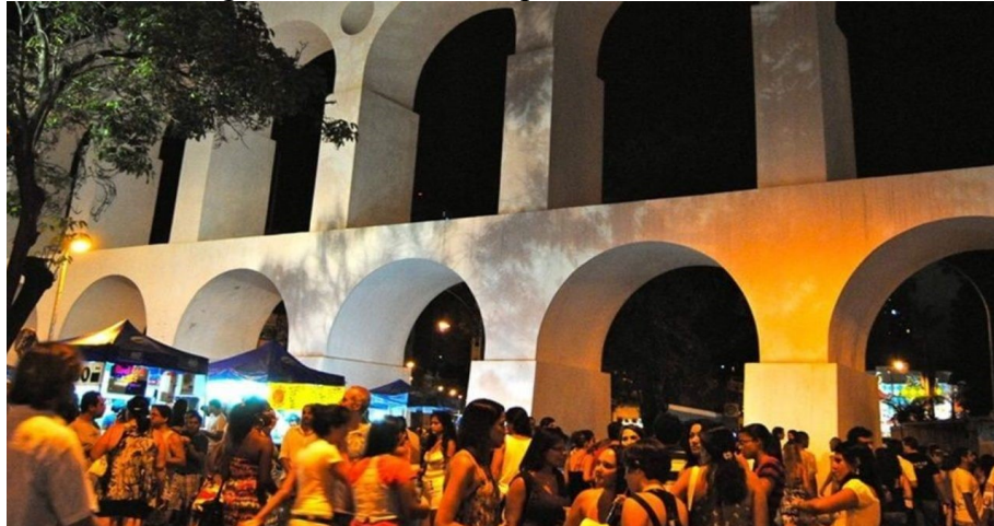
Figura 9 – Bairro da Lapa no Rio de Janeiro