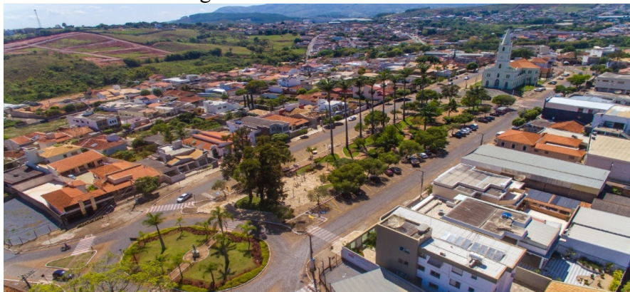
Figura 10 – Cidade de Piumhi

Além disso a cidade de Piumhi vem planejando e implementando ações voltadas para incrementar sua capacidade de promover o turismo local, de acordo com o que está previsto no plano diretor da cidade (Lei complementar nº 67/2019), em seu artigo 50, que define as estratégias municipais de promoção do turismo. O inciso VII traz a “participação efetiva do município no circuito turístico” (CÂMARA MUNICIPAL DE PIUMHI, 2019).