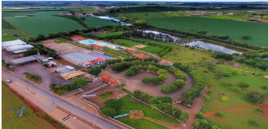
Figura 11 – Piumhi Tênis Clube

Dentro do município de Piumhi, um dos locais mais atrativos para os turistas é o Piumhi Tênis Clube (Figura 11), um clube campestre que conta com lagos, piscinas, áreas de churrasco, academia e atividades esportivas variadas, onde o turista pode adquirir uma entrada válida por todo o dia e os cidadãos da cidade podem se tornar sócios do clube tendo acesso ilimitado. O local ainda possui estrutura para grandes eventos e é tradicionalmente uma das sedes das maiores festas e shows da região.