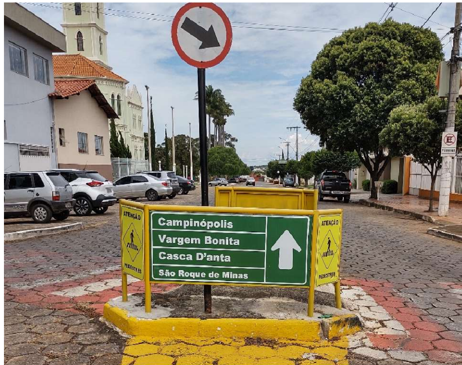
Figura 17 – Placa Indicativa na Cidade de Piumhi

local, além da Casa da Cultura, onde o turista pode conhecer um pouco mais da história do município e da região (Figura 17).