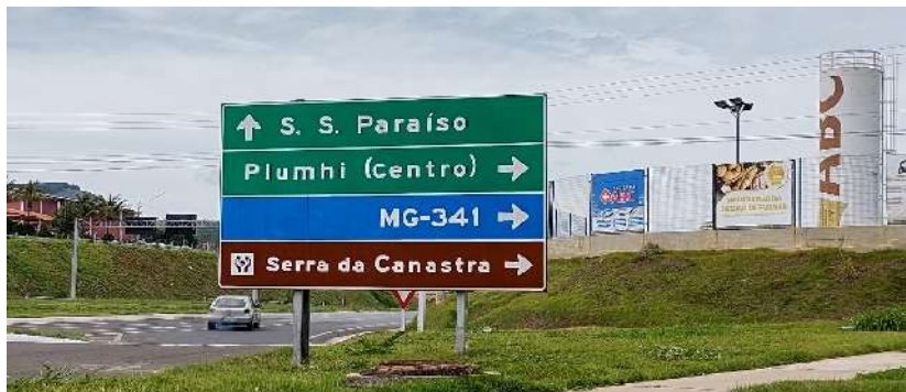
Figura 16 – Placa Indicativa na Cidade de Piumhi

Percebe-se que a região de Piumhi carece de sinalizações turísticas nas margens das rodovias que passam pelo local. Trafegando pela rodovia MG-050, só é possível visualizar uma quantidade significativa de placas de indicativos turísticos na região de Turvo, após a cidade de Capitólio (Figura 16).