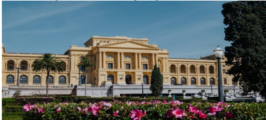
Figura 3 – Museu do Ipiranga em São Paulo

Para facilitar a compressão desta categoria podemos citar como exemplos o edifício onde está instalado o Museu do Ipiranga na cidade de São Paulo (Figura 3), a Catedral da Boa Viagem em Belo Horizonte (Figura 4), o Morro do Cristo Redentor na cidade do Rio de Janeiro (Figura 5) e a região do Pelourinho na cidade de Salvador (Figura 6). Estes exemplos são marcos que possibilitam reconhecer imediatamente em que cidade e/ou região estão localizados. É importante ressaltar que todos os exemplos apresentados neste estudo são apenas para exemplificar cada categoria, e não significa necessariamente, que cada uma das cidades mencionadas pode ou não ser considerada como acolhedora ou hospitaleira.