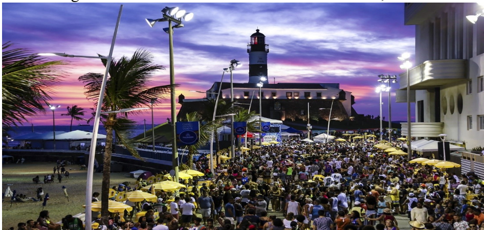
Figura 2 – Carnaval de rua na cidade de Salvador, Bahia