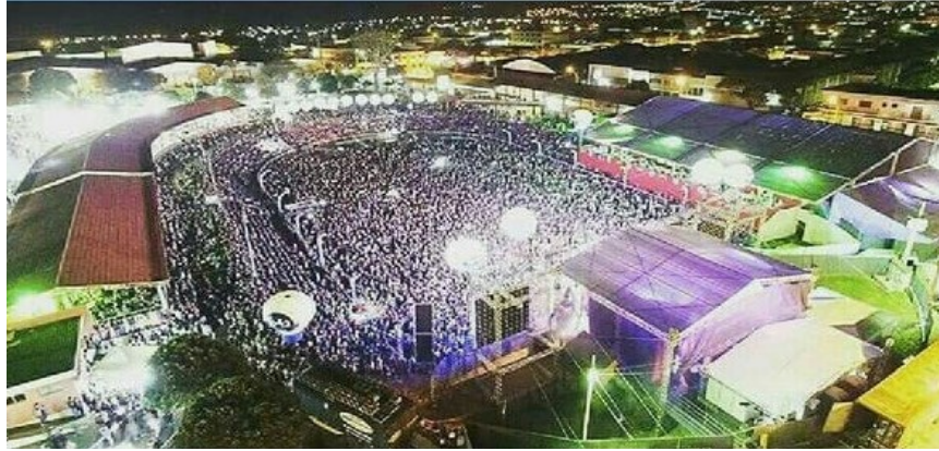
Figura 12 – Parque de Exposições de Piumhi

(Figura 12), espaço com infraestrutura e com potencial para receber outros eventos durante o ano.