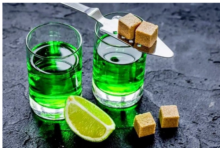
Figura 1: Absinto pronto para ser consumido

Apesar de ter sua imagem comumente ligada à França devido ao seu consumo por artistas parisienses da época, o absinto é uma bebida de origem suíça. E em seu país de origem o uso da bebida era tão comum que havia a chamada “hora verde”, um momento em que as pessoas se reuniam diariamente entre as 17h e 19h para tomar uma dose da bebida.