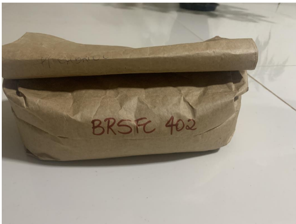
Figura 3 - Semente de Feijão adquirida de Fábio Aurélio da EPAMIG, Bambuí – MG/2023.