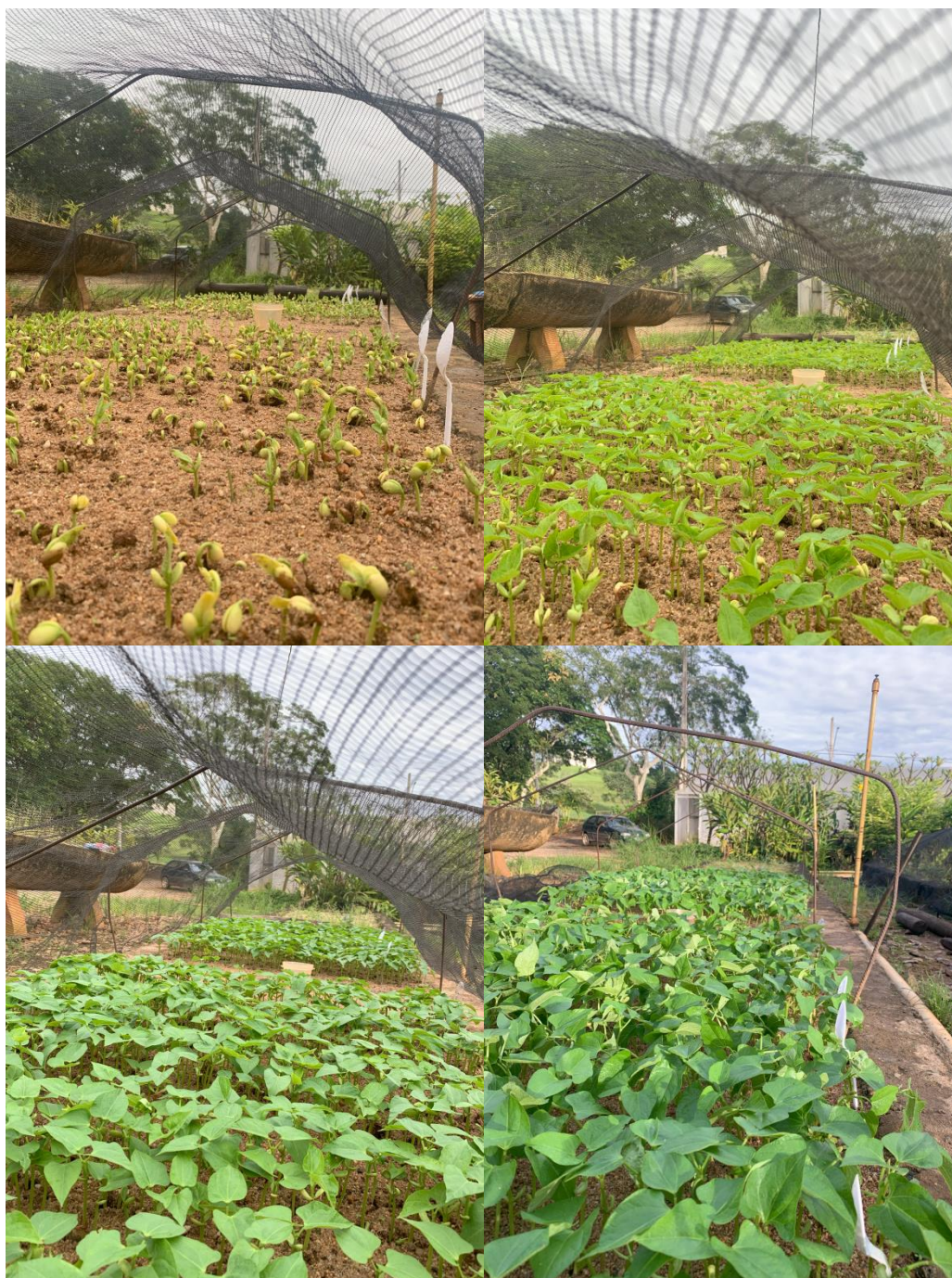
Figura 7 - Semeadura das sementes de Feijão, após a emergência na caixa de areia. Bambuí-MG/2023.

Logo ao emergir a primeira plântula no dia 11 de março de 2023, as leituras foram realizadas a cada 12 horas, até estabilização da emergência, onde deve ter três leituras seguidas contendo o mesmo número de plântulas emergentes, sendo assim, ocorrendo o fechamento das leituras do experimento no dia 15 de março de 2023.