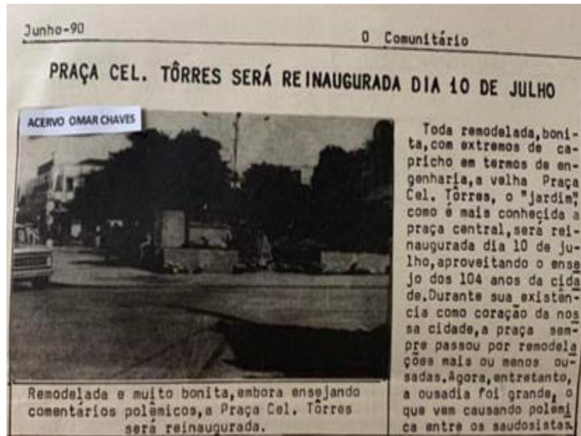
Figura 10- Panfleto de reinauguração da praça