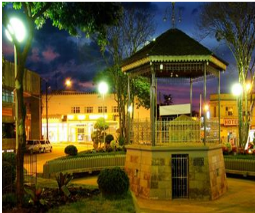
Figura 14- Praça Coronel Tôrres e coreto principal