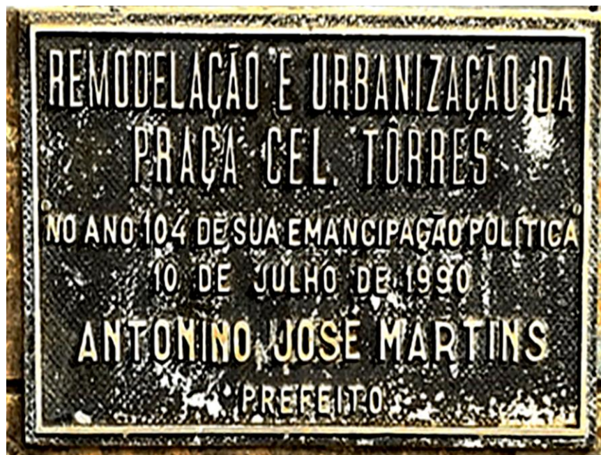
Figura 11- Placa de remodelação da praça

A placa fixada ao coreto central da praça (Figura 11) que até hoje permanece exposta aos que passam por ali, marca um momento de história de acontecimentos que naquele espaço ocorreu.