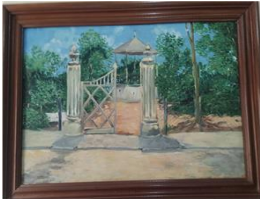
Figura 3- Quadro retratando o coreto antes da construção da praça

De outro ponto de vista Juste & Paiva (2015), também fazendo pesquisas históricas relata que esses portões cercado as praças eram comuns e feitos na época com a intenção de impedir a entrada de animais que viviam soltos pelas ruas e também para preservação do ambiente em si fazendo uma comparação com os jardins Europeus, porém também destaca que esse cercado poderia ser um método de controle de entrada e permanência das pessoas, criando uma seleção apenas de uma parcela frequentada nesse ambiente.