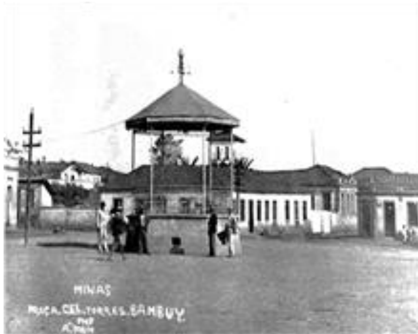
Figura 2-Coreto antes do ajardinamento da praça