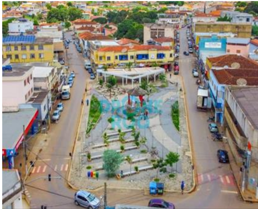
Figura 20-Praça Coronel Tôrres revitalizada e arborizada