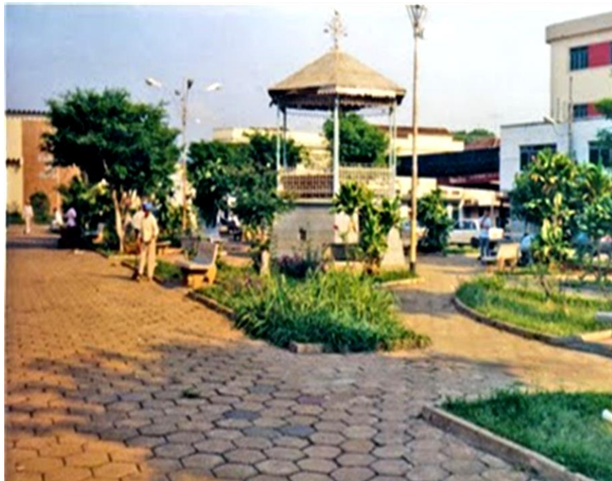
Figura 9- Antes da elevação dos canteiros