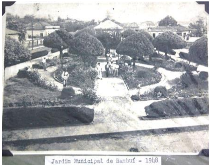
Figura 5- Ajardinamento e árvores já plantadas