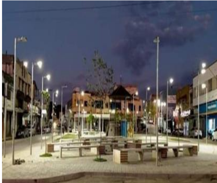
Figura 19- Praça quando começou a arborização