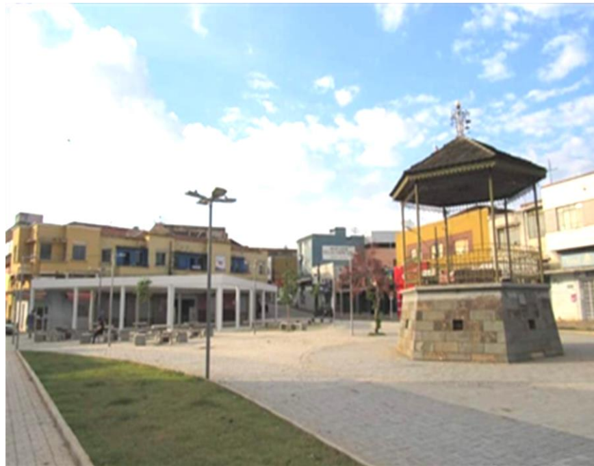
Figura 18- Antes da arborização da praça