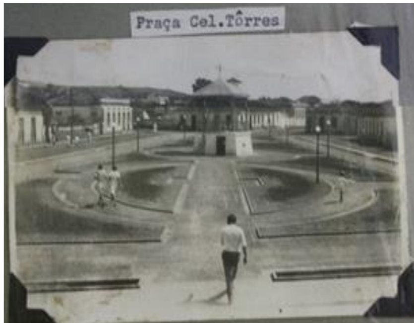
Figura 4- Canteiros formados da Praça Coronel Tôrres