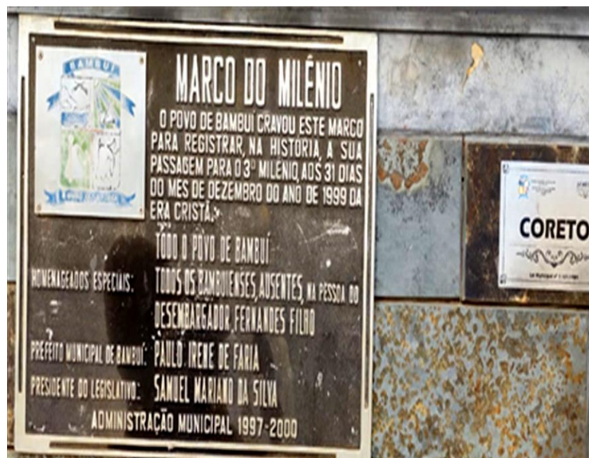
Figura 15- Placa fixada no coreto

Contudo podemos enfatizar que o aspecto da praça ilustrado na Figura 9 em comparação à imagem mostrada na Figura 14 sofreu uma grande mudança, um avivamento, mostrando-a mais arborizada e com uma iluminação adequada destacando toda a beleza da praça e juntamente a do coreto central, que recebeu a placa fixada no coreto em memória ao marco do milênio, na administração de 1997-2000 obtendo como prefeito o Sr. Paulo Irene de Faria.