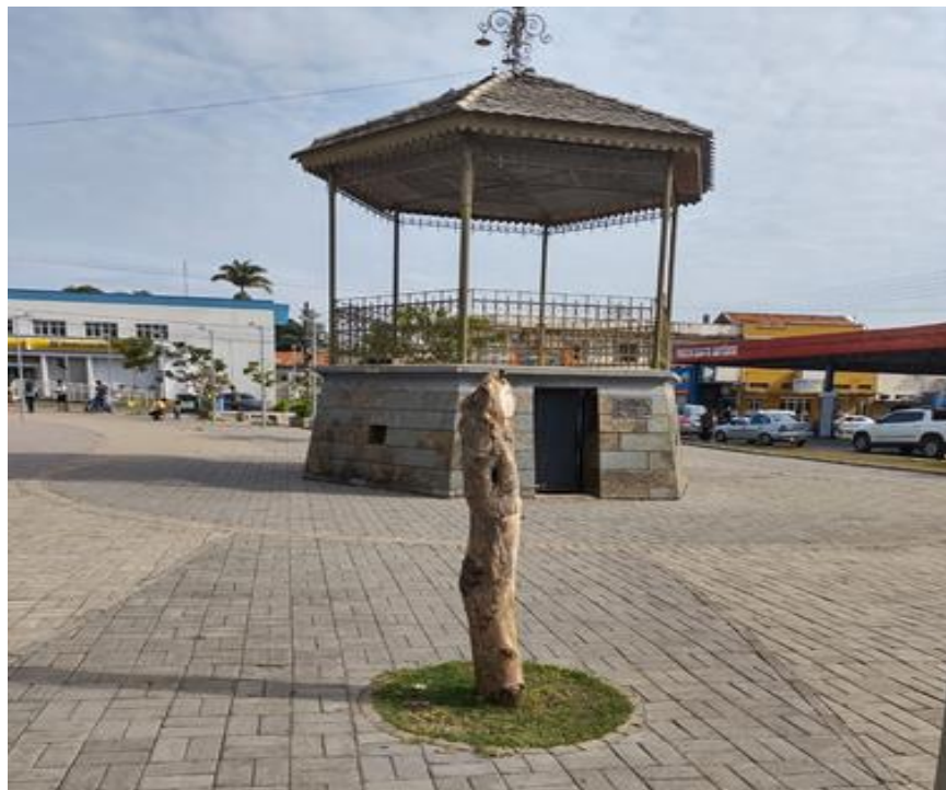
Figura 16- Tronco da árvore de Pau Brasil mantida na praça

De acordo com Morigi (2016), as praças públicas, por se tratarem de um espaços de uso público, elas merecem uma atenção maior do poder público, que deve apresentar um planejamento adequado para sua gestão, onde precisa contemplar algumas ações prioritárias, sobretudo, aquelas atreladas a escolha de espécies arbóreas consideradas mais adequadas para as condições daquele tipo de espaço, ou seja, espécies arbóreas que tenham as condições adequadas para oferecer um bom sombreamento, mas que também sejam de fácil manutenção.