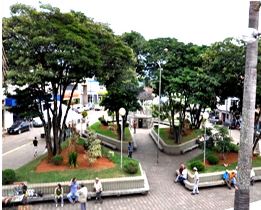
Figura 13- Praça Coronel Tôrres