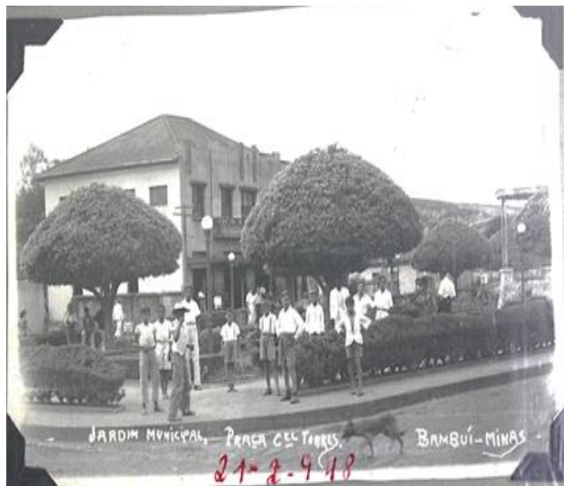
Figura 6-Jardim da Praça Coronel Tôrres