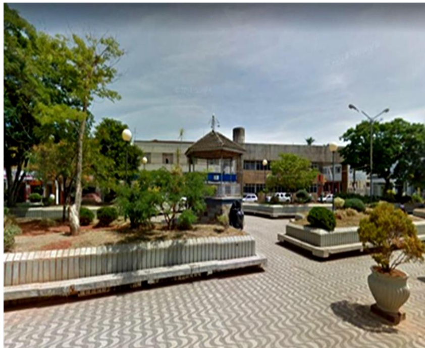
Figura 12- Canteiros elevados e bancos em volta dos canteiros

Pode ser observado nas (Figuras 12,13,14) a revitalização que ocorreu na Praça Coronel Tôrres destacando os canteiros elevados e seu jardim refeito aproveitando somente algumas árvores que já estavam no local, ganhando um novo estilo e aspecto, sendo implantado vasos grandes, meio suspensos com pequenos arbustos para complementação de um novo paisagismo. O calçamento desta praça também lembra muito ao calçamento da Praia de Ipanema no Rio de Janeiro.