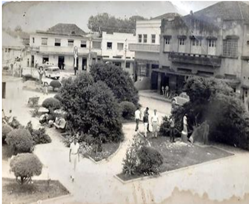
Figura 8- Corte das árvores de Ficus