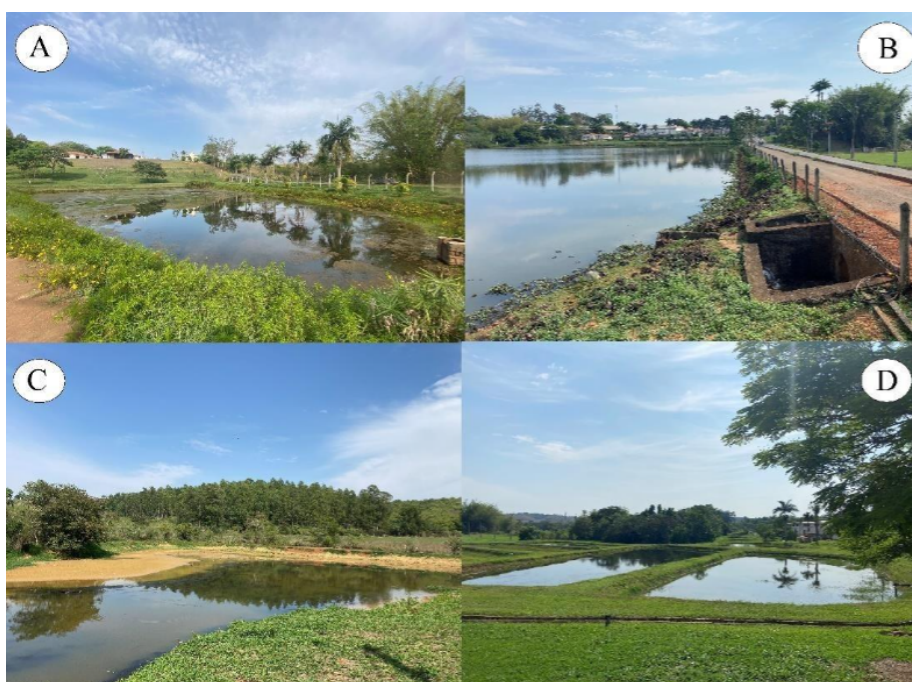
Figura 1. Localidades amostradas para inventariar a odonatofauna no IFMG - Campus Bambuí, Minas Gerais: Lagoa da Portaria (A), Lagoa Pousada das Graças (B), Lagoa do Vale das Cruzas (C) e Tanques de Piscicultura (D).

As coletas ocorreram em quatro localidades do campus, sendo elas: (1) Lagoa da portaria, com uma área aproximadamente de 2 ha, com vegetação predominante herbácea em seu entorno, próxima de edifícios e de uma rodovia, com cerca de vinte anos; (2) Lagoa Pousada das Garças, área com cerca de 20,23 ha, com vegetação arbórea, arbustiva e herbácea em seu entorno, com presença de plantas aquáticas, próxima de edifícios e fragmentos de Cerrado, com cerca de cinquenta anos; (3) Lagoa do Vale das Cruzas, área com cerca de 6,3 ha, com vegetação herbácea em seu entorno e próxima de fragmentos de cerrado, com cerca de quarenta anos e; (4) Tanques de Piscicultura, sendo três tanques de 1080, 860 e 640 m 2 , com vegetação herbácea em seu entorno e próximo de prédios e fragmento de cerrado, com cerca de quarenta e cinco anos. A figura 1 ilustra as quatro localidades amostradas descritas.