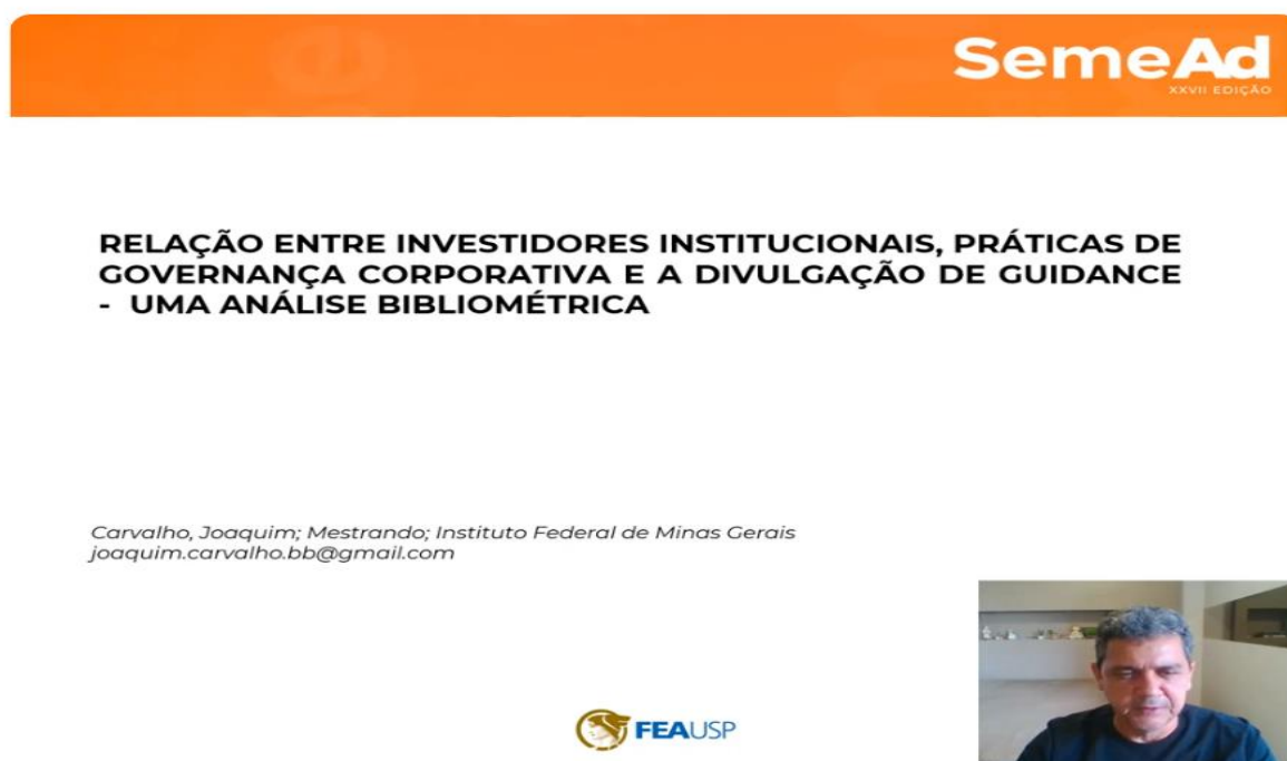
Figura 4 – Tela da apresentação “SEMEAD 2025”

https://sites.google.com/view/instgovguide?usp=sharing em 01.02.2025