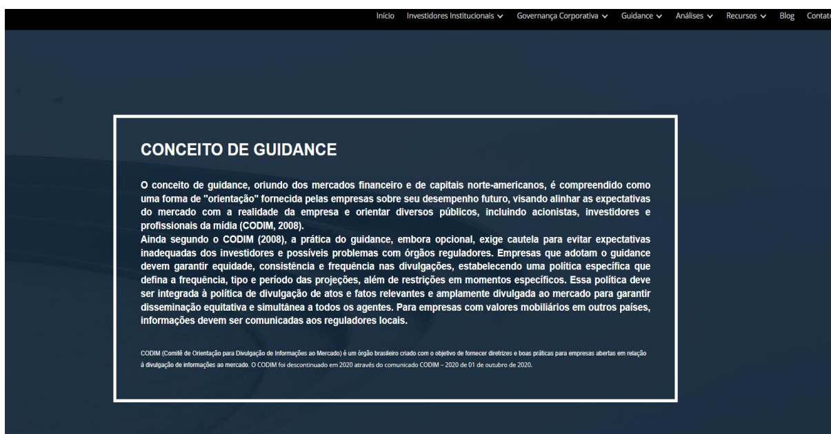
Figura 5 – Tela de apresentação do conceito de guidance

https://sites.google.com/view/instgovguide?usp=sharing em 01.02.2025