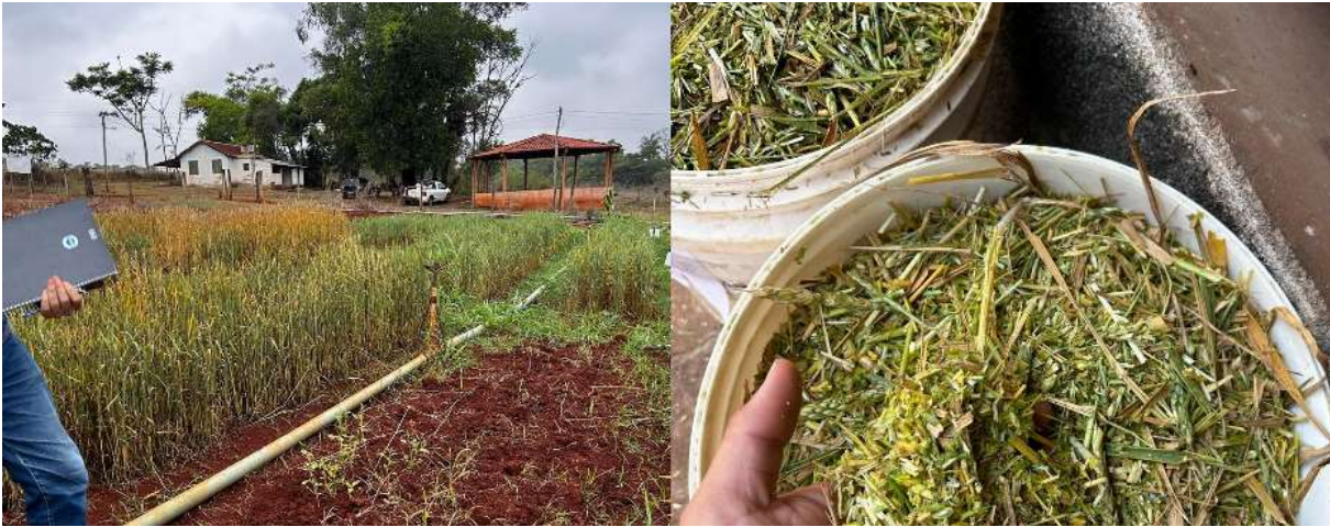
Figura 1 -Área experimental no IFMG Campus Bambuí onde foi plantado o trigo.