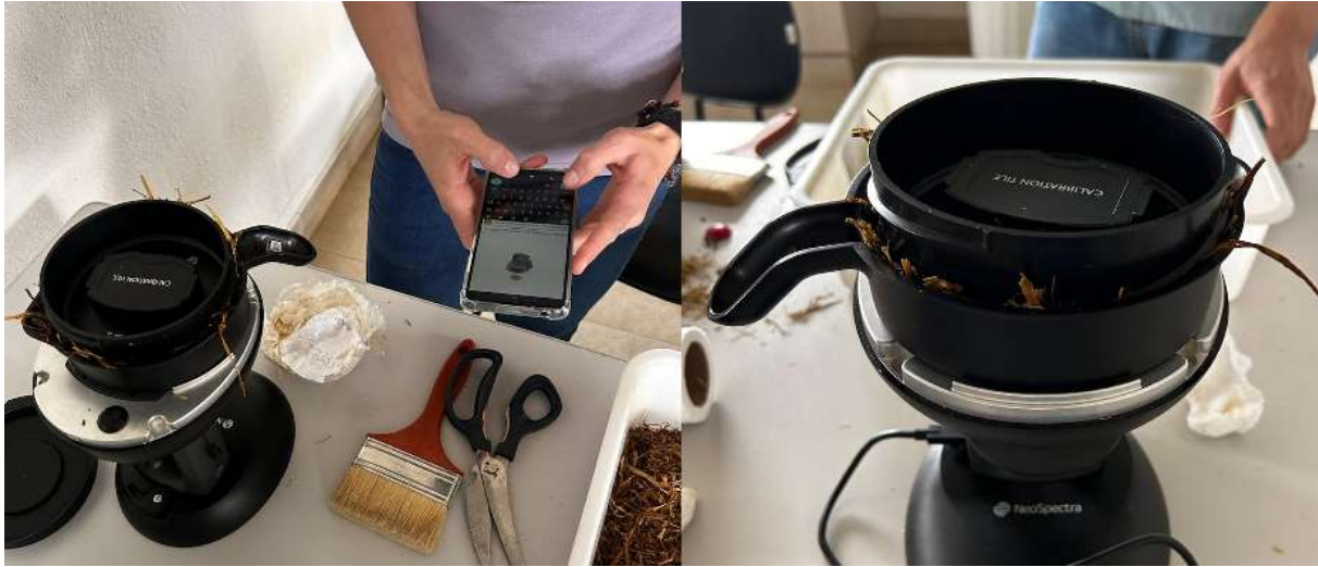
Figura 2: Equipamento NeoSpectra by Si-Ware (NIRS) utilizado para análise bromatológica .