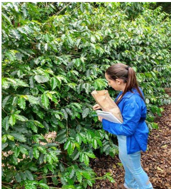
Figura 1: Coleta de folhas do cafeeiro no município de Camacho-MG.