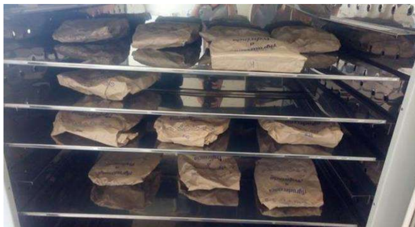
Figura 2: Amostras de folhas de café dispostas em estufa para secagem, Bambuí-MG, 2019.