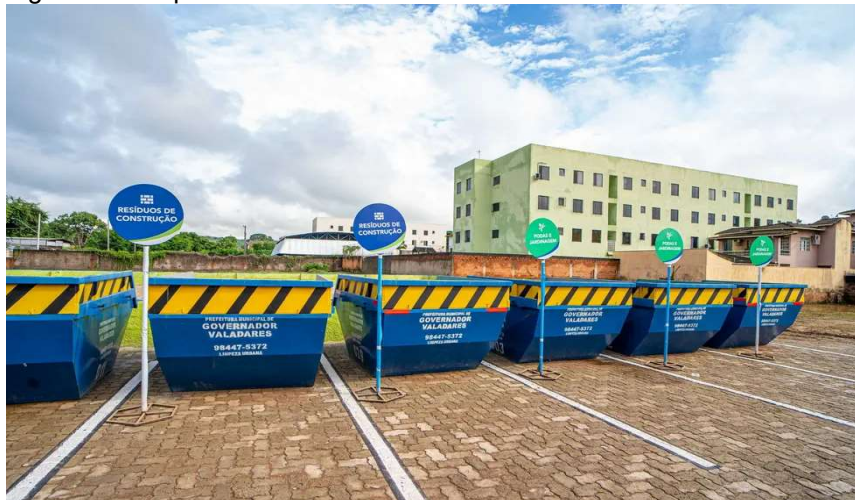
Figura 1 - Ecoponto no bairro Santos Dumont em Governador Valadares

Conforme estabelecido no Decreto n° 10.455, datado de 1° de dezembro de 2016, é uma obrigação do Departamento de Limpeza Urbana a elaboração de relatórios abrangentes que contemplem a quantidade e a tipologia dos resíduos que estão sendo depositados nos referidos Ecopontos, entretanto, tais relatórios não estão sendo elaborados. Estas informações são cruciais para garantir uma eficiente gestão de resíduos e monitoramento adequado das operações em curso, cumprindo, assim, com as regulamentações e normas vigentes.