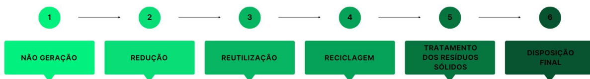
Fluxograma 2: etapas de prioridades do gerenciamento de RS, segundo a PNRS

A legislação impõe a ordem de prioridade para o gerenciamento adequado de qualquer tipo de resíduo sólido, como o RCD. Os geradores são os responsáveis pela implementação do Plano de Gerenciamento dos Resíduos, a fim de realizarem o cumprimento das 4 primeiras etapas dessas prioridades, que são: