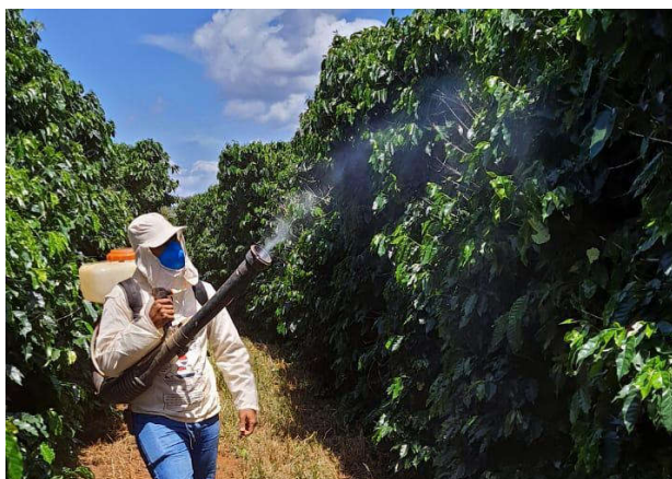
Figura 2. Pulverização dos produtos