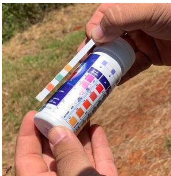
Figura 1. Fita indicadora de pH

A aplicação foi feita com tubo atomizador costal da marca STHIL com capacidade máxima de 15 litros de calda. O volume de aplicação foi regulado para 400 litros de calda por hectare. Com o espaçamento de 3,5 m x 0,7 m resultou-se numa população de 4.082 plantas por hectare, sendo que cada planta recebeu 98 ml de calda, sendo necessário 4,7 litros para pulverizar todas as plantas de cada tratamento. O pH da calda foi medido e obtendo se o valor aproximado de 5,5 (Figura 1). A pulverização foi realizada às 9h 20, com temperatura próxima a 26 °C e a umidade relativa do ar próxima aos 62% (Figura 1).