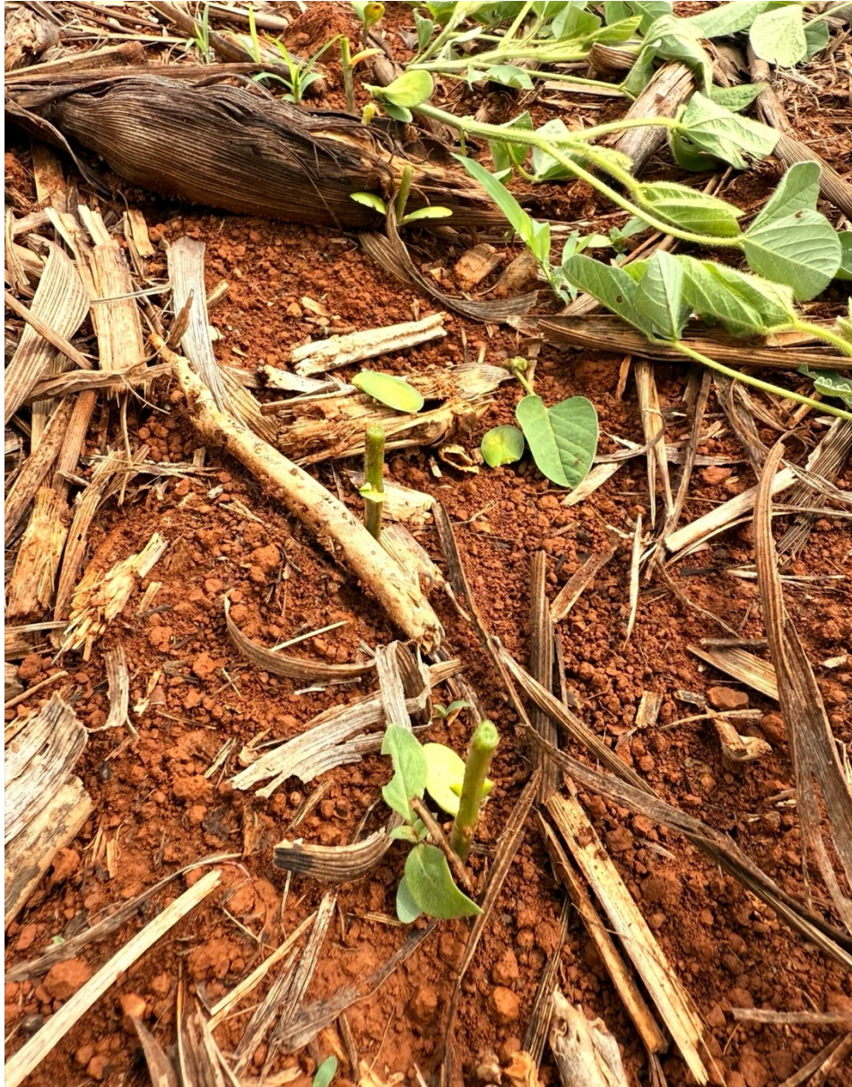
Figura 7 Recepa intensiva para o tratamento T6.