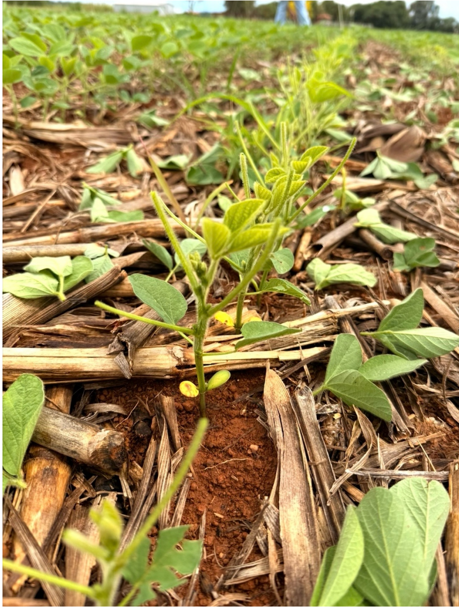
Figura 6 Retirada dos 3 trifólios no tratamento T5.