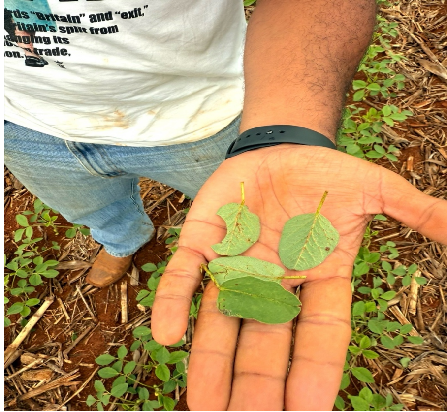
Figura 4 Unifolioladas para o tratamento T3.