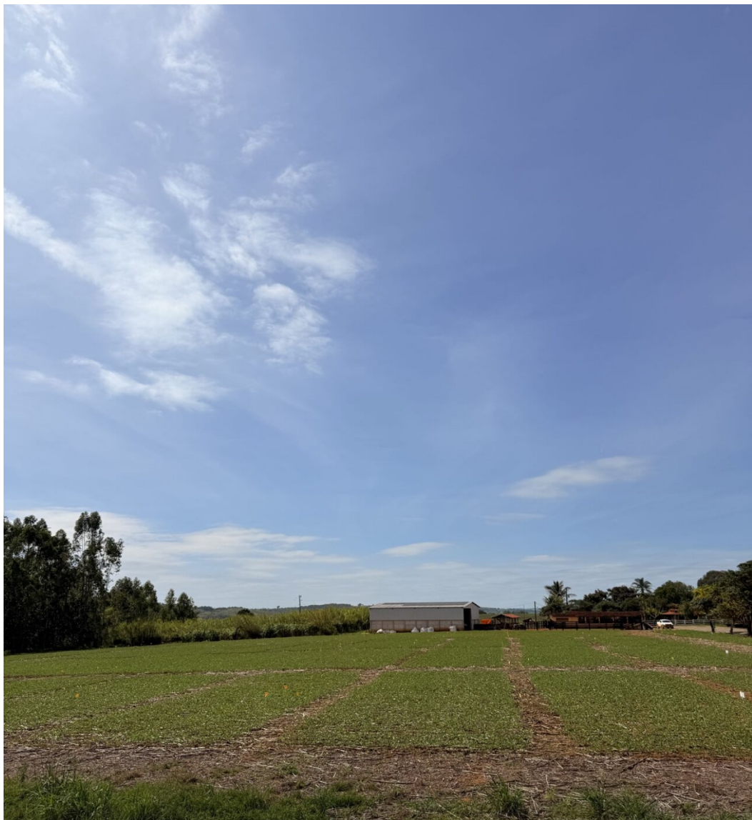
Figura 1 Localização e delimitação do local do experimento na Fazenda Santa Luzia, município de Bambuí, MG.

Este estudo foi realizado no município de Bambuí na Fazenda Santa Luzia, localizada nas coordenadas geográficas 20°01'02"S e 45°55'42"W, a uma altitude de 765m conforme a Figura 1. A área de estudo possui solo com leve declividade e textura argilosa.