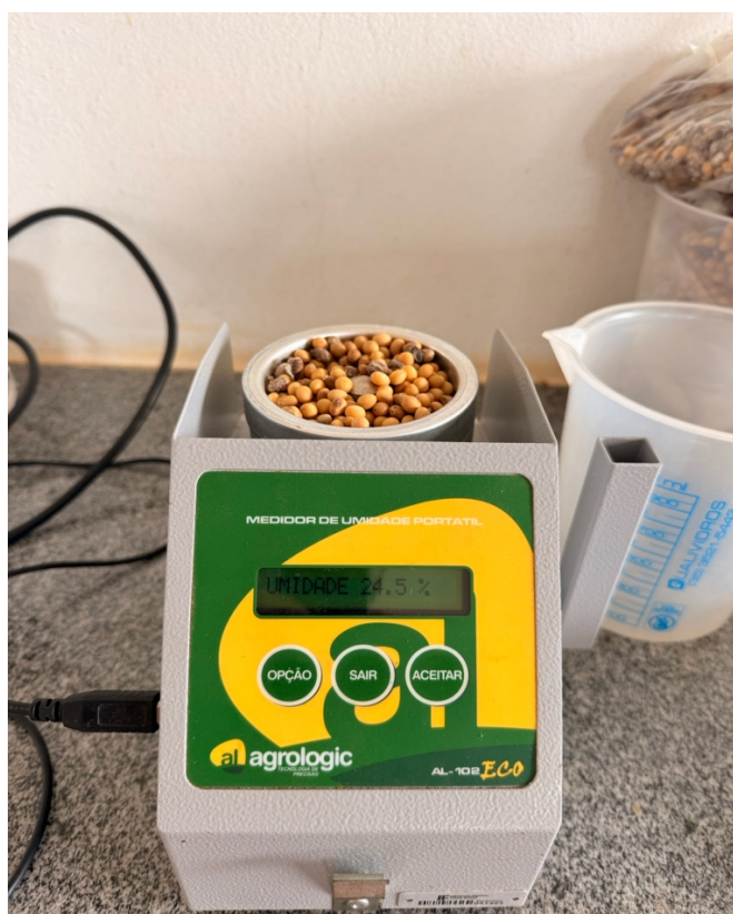
Figura 9 Utilização do medidor de umidade de cada tratamento avaliado.

As parcelas do experimento tinham tamanho de 12 m 2 , compostas por 4 linhas com espaçamento de 0,5 m e comprimento de 6 m. As plantas localizadas nas bordaduras do comprimento das parcelas, correspondentes a 0,5 m de cada lado, foram descartadas, assim como as a linha da bordadura. Para a análise, tanto de desenvolvimentos quanto de produtividade, foram utilizadas 10 plantas, presentes nas duas linhas centrais de cada parcela, e posteriormente colhidas, totalizando 6 m 2 . Foi medido a altura da inserção da primeira flor e o número de vagens por plantas. As plantas foram colhidas em períodos distintos, quando apresentavam-se visualmente secas com os grãos em estágio de maturidade fisiológica. Após a colheita foi realizada a aferição do peso utilizando uma balança de precisão e da umidade dos grãos utilizando um medidor de umidade (Figura 3). O peso foi convertido para a umidade de 13% e a partir daí calculado a produção em Kg ha -1 .