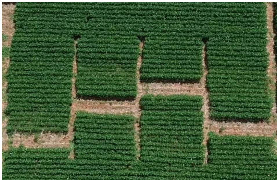
Figura 8 Desenvolvimento dos tratamentos 38 dias após desfolha.