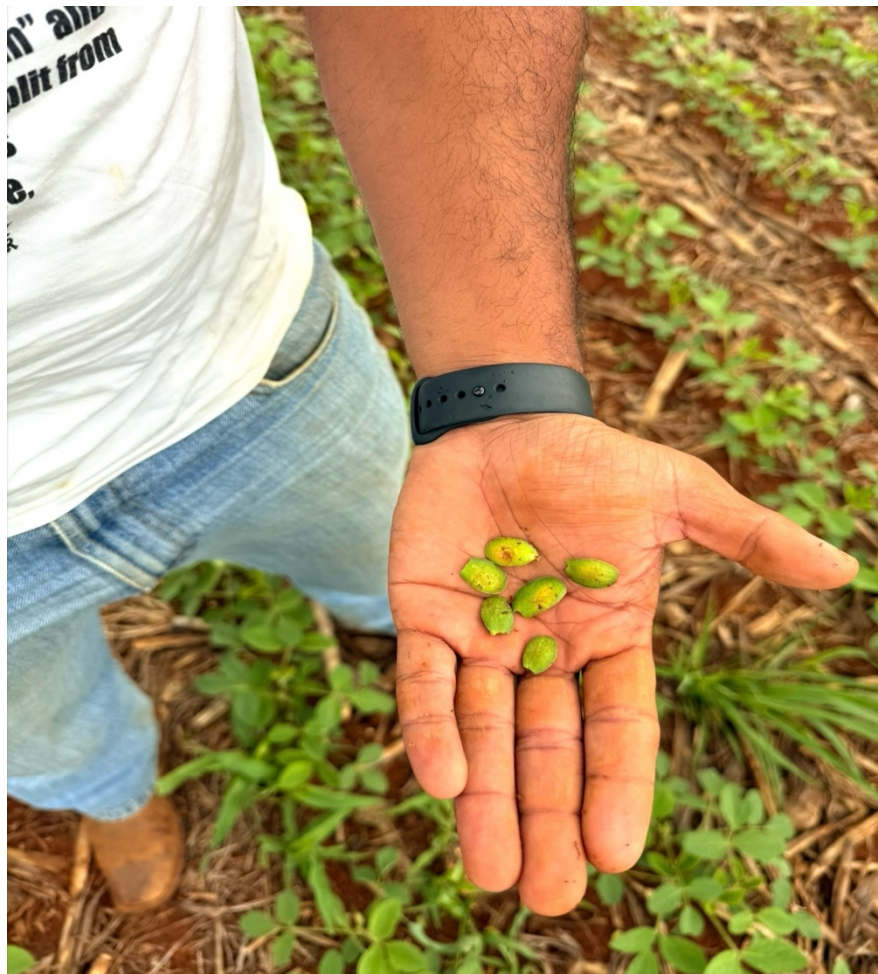
Figura 3 Retirada dos cotilédones para tratamento T2.