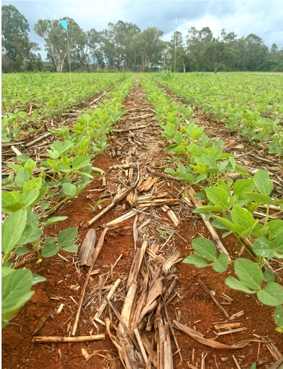
Figura 5 Tratamento T4 com retirada de uma unifoliolada e um cotiledone.