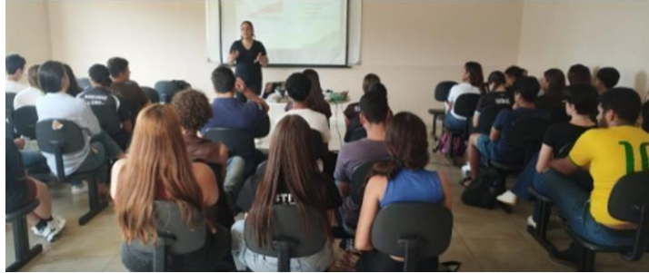
Figura 4 - Aula teórica, dialogada e reflexiva no primeiro encontro