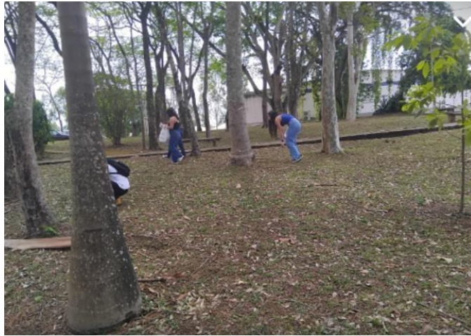
Figura 5 – Corrida de orientação com coleta de sementes pelo campus