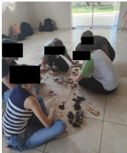
Figura 6 – Contabilização das sementes coletadas