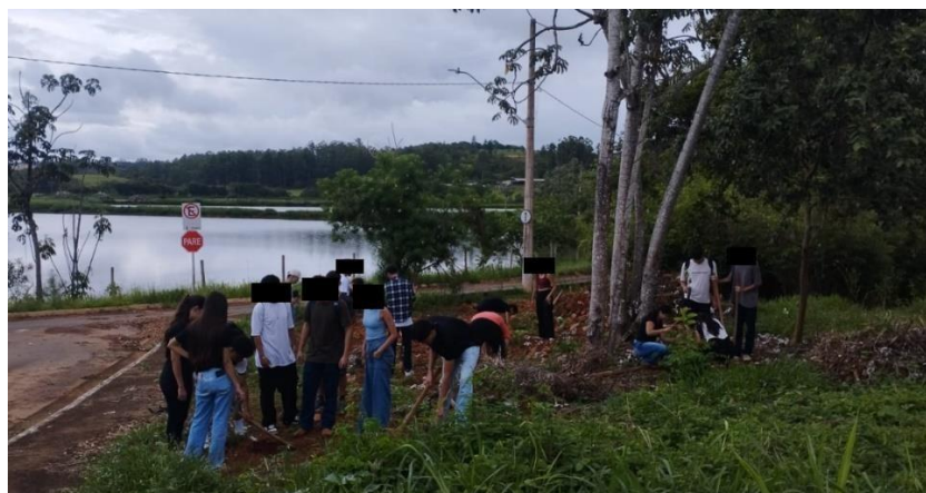
Figura 7 – Plantação da “mini floresta” da turma

Por fim, no último encontro, cada turma realizou o momento de plantação de árvores na mini floresta da turma (Figura 8). Foi observada boa participação e interesse dos estudantes. A mini floresta além de ser uma efetivação da proposta integradora de Educação Ambiental com Educação Física, se tornou um referencial físico das turmas que persistirá por anos dentro do campus. O estudo de Silva et al. (2022) reforça nossos achados ao mostrar que o plantio de mudas por estudantes do Ensino Médio ampliou significativamente o entendimento sobre arborização, sustentabilidade e cuidado com o ambiente. Embora apresentassem conhecimentos iniciais bastante básicos, os participantes demonstraram mudança conceitual ao longo do projeto.