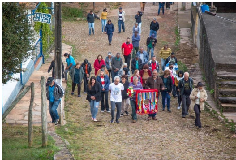
Figura 1: Cortejo da Bandeira do Divino Espírito Santo

A festa do Divino ocorre em diversos estados do Brasil e é possível atribuir sua origem em Portugal no século XIV, instituída por D. Diniz por influência de sua esposa, a rainha Isabel. Com a finalidade de arrecadar recursos para a festa realizava-se anteriormente a festa do Divino, a folia do Divino na qual grupos de cantadores visitavam as casas dos fieis para pedir donativos e todo tipo de auxílio. Os fieis levavam a Bandeira do Divino, ilustrada pela Pomba que simboliza o Espírito Santo.