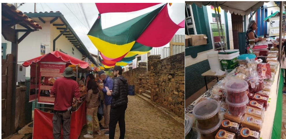
Figura 2: Barracas de doce na Rua do Carmo

Esse evento que geralmente dura três dias (sexta, sábado e domingo) se concentra na rua do Carmo, na qual são dispostas as diversas barracas (Figura 2) com os variados doces para comercialização. Além dos doces, é possível encontrar sendo comercializados artesanatos, produtos de higiene e beleza e outras produções gastronômicas.