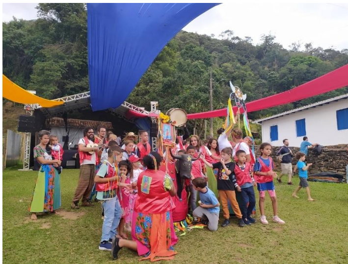
Figura 4: Cortejo de abertura da Festa da Goiaba e apresentação do Boi da Manta