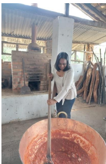
Figura 3: Oficina de produção da goiabada Cascão

Na edição mais recente do evento estavam disponíveis para os visitantes opções como pão com pernil, tropeiro, pasteis fritos, pastel de angu, galinhada tradicional com quiabo tostado, pães, bolos e broas. Para os visitantes que queriam se aventurar mais na tradição de produção de doces artesanais (Figura 3), foram realizadas oficinas de produções de doces com doceiros representantes da ADAF. Oficinas de produção de "Suflê de Goiabada", "Umbigo de Banana", e uma oficina para o público infantil de "Biscoitinho Casadinho de Goiaba" também foram ministradas (O TEMPO, 2023).