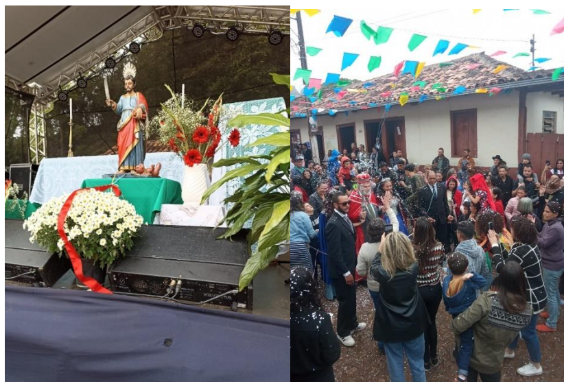
Figura 5: Imagem do Padroeiro São Bartolomeu no altar e Cortejo do Rei e da Rainha

Atualmente a Igreja Matriz de São Bartolomeu que se encontra na rua do Carmo está fechada para restaurações desde 2023 por problemas estruturais, elétricos e relacionados com os painéis artísticos presentes em seu interior (NMPG, 2023). Para celebrações e algumas das atrações durante o evento é montado um palco ao lado da igreja.