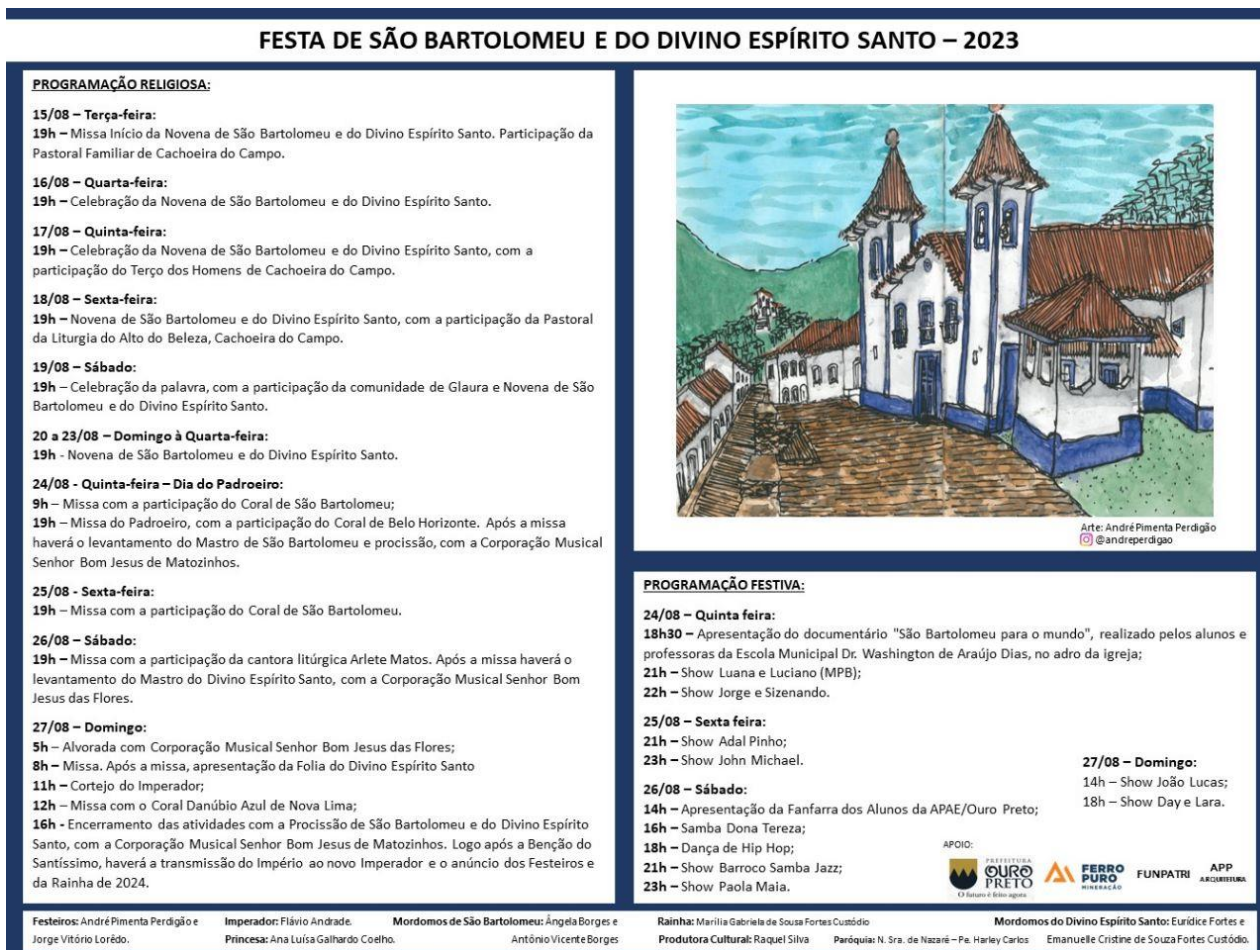
Figura 6: Programação da Festa do Padroeiro de 2023