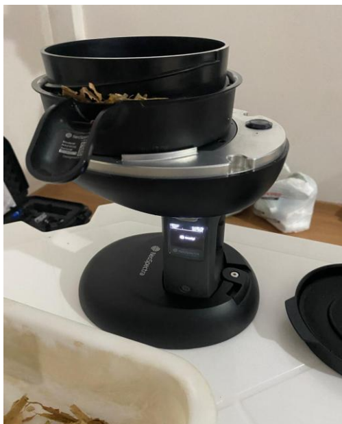
Figura 3: Equipamento utilizado para analisar.